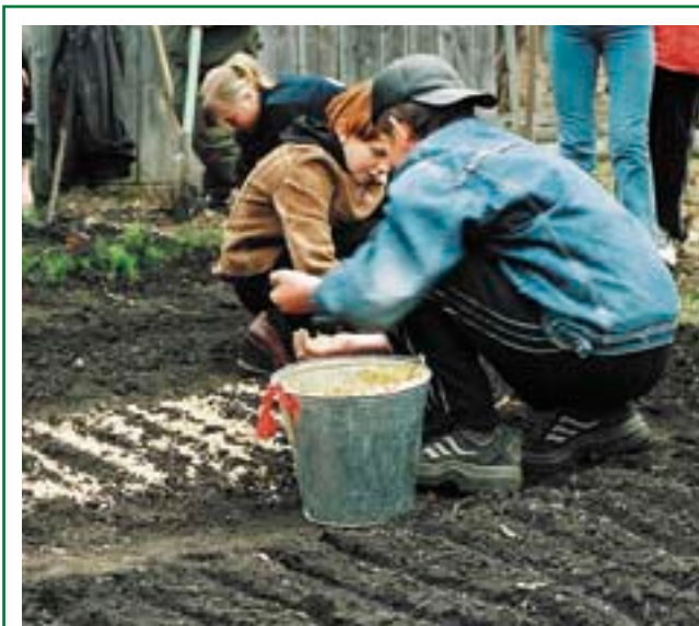
Посев семян в лесном питомнике. Между рядами мульчируются (укрываются) древесными опилками, чтобы уменьшить высыхание почвы и ослабить рост сорняков

При смешанных посадках (посадка в пределах одного участка двух или более разных древесных пород) могут использоваться одновременно саженцы одной древесной породы, и сеянцы или даже семена другой. Например, при смешанной посадке сосны и дуба можно использовать трехлетние или четырехлетние саженцы сосны и однолетние или двухлетние сеянцы или желуди дуба.