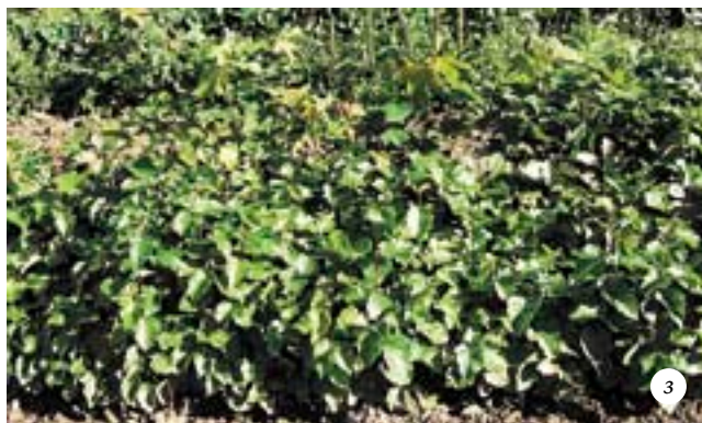
Выращивание березы бородавчатой и серой ольхи: а — смесь семян березы с семенными чешуями (стрелочкой обозначена одна из чешуй); б — всходы березы недельного возраста; в — всходы серой ольхи недельного возраста; г — всходы-дички березы на обочине шоссе; д — всходы березы через месяц после посева семян; е — всходы ольхи через месяц после посева семян; ж — сеянцы березы первого года жизни в середине лета; з — сеянцы березы первого года жизни в начале осени (на среднем плане видны сеянцы ольхи)