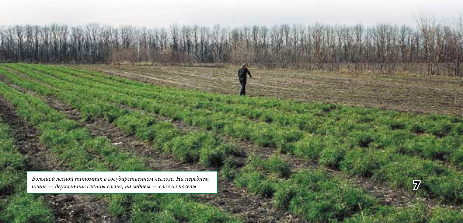
Большой лесной питомник в государственном лесхозе. На переднем плане — двухлетние сеянцы сосны, на заднем — свежие посевы

Использование крупных саженцев предпочтительнее и в том случае, если существует опасность