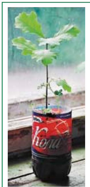
Сеянец дуба, выращенный за лето в домашних условиях

Зимовка «домашних» саженцев должна происходить под снегом: там теплее и корневые системы саженцев не пострадают. Всходы лишь немногих деревьев (например, лиственницы или кедра) способны перенести суровую зимовку без укрытия снегом, и то лишь в относительно мягкие зимы. Подготовка «домашних» саженцев к зимовке — дело не простое: если сеянец выставить сразу из тепла на мороз, он тоже погибнет. Нужна закалка саженцев, т.е. надо выставить их на улицу еще в сентябре, пока не очень холодно. Все это довольно сложно, поэтому лучше всего выращенные в комнате саженцы уже осенью высаживать на постоянное место.