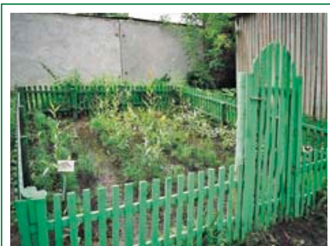
Небольшой лесной питомник, в котором выращиваются саженцы сосны, лиственницы, ивы и дуба. Такой питомник послужит украшением школьного участка и наглядным пособием для уроков биологии

В последние десятилетия все большее распространение получает выращивание так называемого посадочного материала с закрытой корневой системой, т.е. саженцев или сеянцев, растущих в специальных горшках-контейнерах. При пересадке на постоянное место такие саженцы вынимаются из контейнеров и высаживаются с комом земли, благодаря чему их корневая система совершенно не повреждается и саженцы значительно легче переносят пересадку. Существует несколько различных технологий выращивания саженцев или сеянцев с закрытой корневой системой. В мире