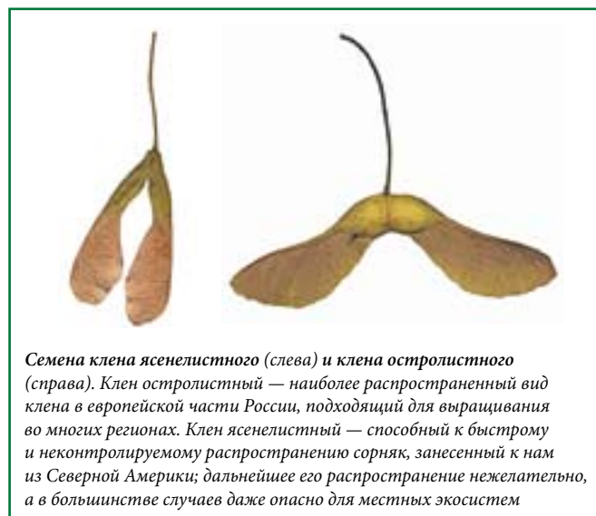
Семена клена ясенелистного (слева) и клена остролистного (справа). Клен остролистный — наиболее распространенный вид клена в европейской части России, подходящий для выращивания во многих регионах. Клен ясенелистный — способный к быстрому и неконтролируемому распространению сорняк, занесенный к нам из Северной Америки; дальнейшее его распространение нежелательно, а в большинстве случаев даже опасно для местных экосистем

Семена большинства ив и тополей созревают также в конце мая или июне, в зависимости от погодных условий и региона. Вы можете собрать их — так называемый тополиный пух (ивовые семена выглядят так же) — прямо с дерева или с поверхности земли. Собранные семена надо посеять сразу же — они хранятся даже меньше время, чем семена вязов.