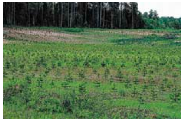
Отработанные карьеры, заброшенные сельхозугодья — наилучшие места для разведения новых лесов в «многолесных» районах. Зброшенний песчаный карьер, засаженный сосной (Вологодская область)