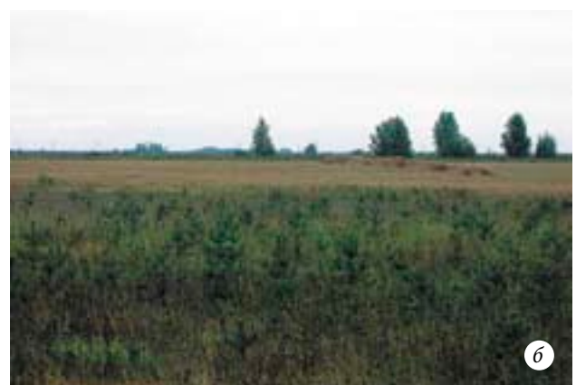
а — выращивание молодого леса на месте срубленного или погибшего старого называется лесовосстановлением; б — выращивание нового леса на ранее безлесном участке называется лесоразведением