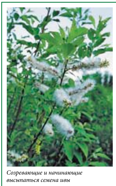
Созревающие и начинающие высыпаться семена ивы

Семена березы проще всего собирать с нижних веток невысоких молодых деревьев (особенно в урожайные годы, которые у березы в средней полосе случаются почти ежегодно). Созревание семян у разных видов берез происходит в разное время. У березы бородавчатой, наиболее обычной в лесостепной зоне Европейской России, семена созревают в июле-августе, а у березы пушистой (встречается там же, но обычно на более влажных местах) — в сентябре и позднее, оставаясь на деревьях иногда до середины зимы. Определить, что семена созрели, можно очень просто: в это время сережки с семенами начинают сами постепенно рассыпаться. Собирайте созревшие сережки целиком — после высушивания они сами распадутся на отдельные семенные чешуйки и семена. Отделять семена от семенных чешуек нет нужды — вы можете их так и посеять. Семена березы хорошо хранятся при комнатной температуре в сухом состоянии (но в холодильнике в плотно закрытой сухой стеклянной банке всхожесть сохраняется еще лучше).