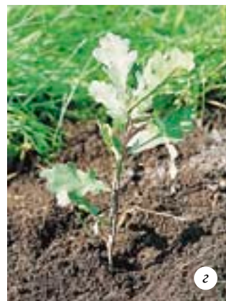
Высаженные на постоянное место саженцы различных древесных пород: а — сосна обыкновенная (возраст саженца — три года); б — ель обыкновенная (четыре года); в — клен остролистый (один год); г — дуб черешчатый (два года)