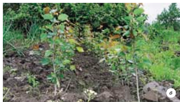
Выращивание осины из семян: а — посев семян; б — сеянцы осины первого года жизни через три месяца после посева семян; в — саженцы осины второго года жизни в «школке»