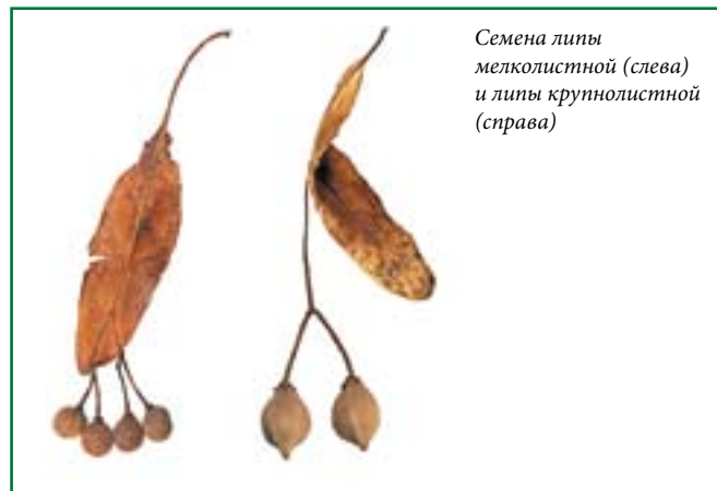
Семена липы мелколистной (слева) и липы крупнолистной (справа)

Семена вязов созревают в конце мая или июне, в зависимости от региона и погодных условий. При созревании они буреют и немножко подсыхают, начинают опадать с деревьев. В это время их и надо собирать — или с дерева (часто нужное количество семян можно легко найти на нижних ветках), или с земли. Помните, что семена вязов живут очень недолго и семена, пролежавшие на земле неделю-другую, могут оказаться невсхожими. Семена после сбора надо подсушить при комнатной температуре и хорошей вентиляции и посеять как можно быстрее (если вы можете посеять их сразу после сбора, то подсушивать не надо).