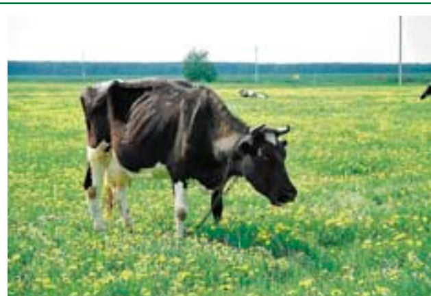
Не следует высаживать деревья на используемых пастбищах и скотопрогонах

Следует также помнить, что некоторые нелесные участки могут иметь большое значение для сохранения редких и подлежащих специальной охране видов растений и животных или быть последними остатками природных степей. Высадка леса на таких участках может привести к неблагоприятным экологическим последствиям — исчезновению угрожаемых видов или экосистем. Для того чтобы этого избежать, старайтесь не засаживать лесом те участки, которые характеризуются редкими для вашей местности условиями (например, выходы известковых скал или особенно сухие и прогреваемые склоны). Используйте для посадки леса те участки, которые явно были нарушены в результате хозяйственной деятельности человека — заброшенные сельскохозяйственные угодья, растущие овраги, карьеры и т.д. Кроме того, относительно выбранного участка можно проконсультироваться у местных специалистов в области охраны природы (чаще всего таких специалистов можно найти в университете, ближайшем заповеднике или в региональном управлении Федеральной службы по надзору в сфере природопользования — Росприроднадзора).