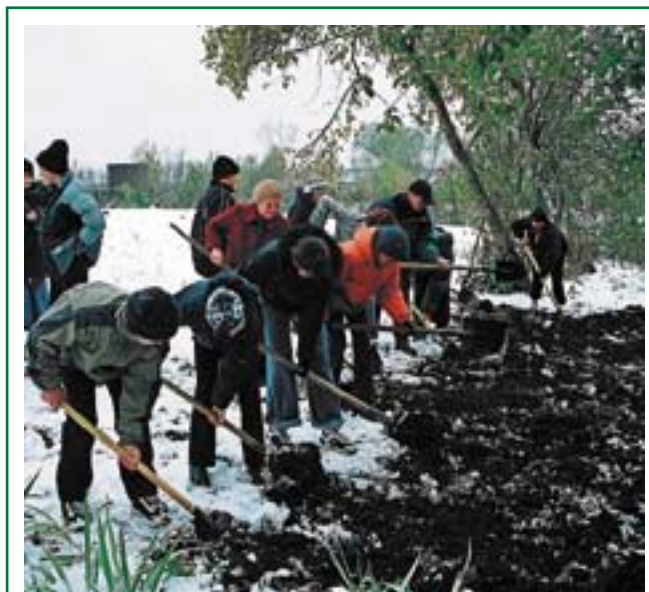
Почву для лесного питомника лучше всего перекопать еще осенью — в этом случае придется тратить значительно меньше усилий на борьбу с сорняками

Основной и обычно требующий наибольших затрат труда и времени в лесном питомнике вид ухода — это прополки и в целом борьба с сорной растительностью. Борьба с сорняками включает в себя прополку гряд и перекапывание междурядий (включая полоски земли, окружающие питомник и специально оставляемые в качестве «полосы препятствий» для длинно-корневищных сорняков). Прополки и перекапывание междурядий желательно проводить настолько часто, чтобы постоянно поддерживать поверхность всего