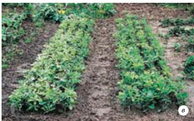
Выращивание дуба: а — весенняя посадка (справа — четыре ряда пересаженных однолетних сеянцев, слева — три ряда высеванных желудей и один ряд, подготовленный для посадки однолетних сеянцев); б — всходы дуба через шесть недель после посева; в — общий вид дубовой части питомника

Желуди прорастают очень долго. Сначала у них развивается мощный корень, достигающий в длину нескольких десятков сантиметров, и лишь после этого начинает расти стебель. Поэтому ростки дуба могут появиться на поверхности почвы только через месяц-полтора после начала прорастания — даже если посев производится весной начавшими прорастать желудями. Не спешите делать вывод, что ваши дубки погибли, и перекапывать грядку с посевами (как показывает опыт начинающих лесоводов-любителей, такое случается). Если же у вас есть сомнения, попробуйте раскопать несколько желудей. Если корни у них выросли, значит, желуди живы.