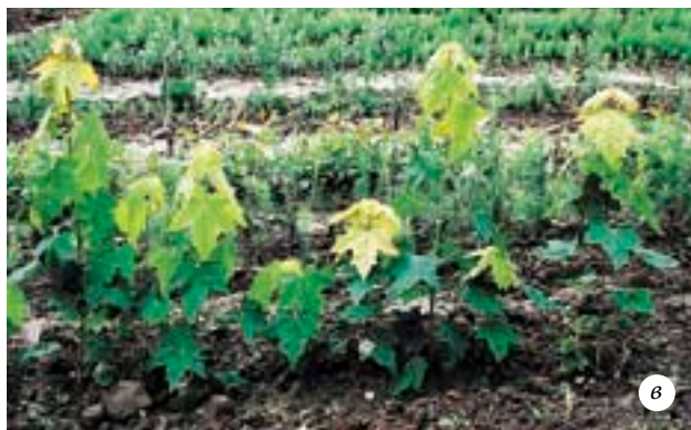
Выращивание клена: а — «дикие» всходы клена под взрослым деревом; б — «дикие» всходы, пересаженные в питомник, через месяц после пересадки; в — крупные однолетние сеянцы клена, выращенные из «диких» всходов