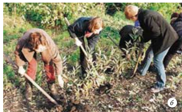
Выращивание ивы из черенков: а — черенки ивы через месяц после посадки; б — выкапывание однолетних саженцев ивы осенью для пересадки на постоянное место