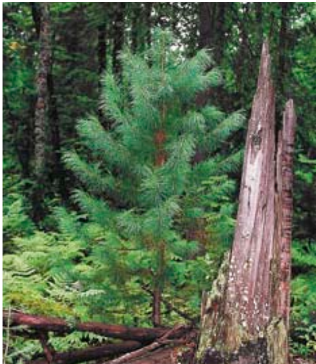
Сибирский кедр почти исчез во многих районах севера Европейской России в результате хозяйственной деятельности человека. Посадка этой породы необходима для восстановления видового разнообразия таежных лесов

В общем, восстановление лесов на вырубках или создание новых лесов в таежной зоне России чаще всего не имеет того большого природоохранного смысла, как в «малолесных» регионах, где и природа, и человек серьезно страдают от недостатка леса. Восстановление хозяйственно-ценных лесов на вырубках имеет, прежде всего, хозяйственный, а не природоохранный смысл, и связано с современной коммерческой деятельностью (заготовкой древесины). В этом случае надо стремиться к тому, чтобы предприятия, ведущие коммерческую заготовку древесины, были обязаны сами восстанавливать хозяйственно ценный лес после своих рубок, тем более что на таких гигантских площадях, которые ежегодно вырубаются сплошь в таежных лесах России (а это примерно 10.000 кв. км), силами общественности вряд ли можно добиться хозяйственно значимого результата.