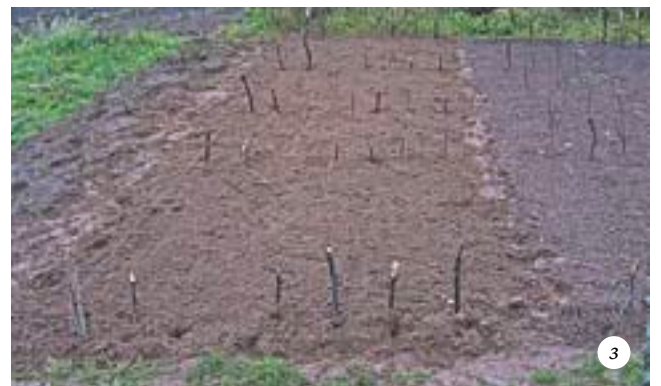
Осенняя посадка желудей дуба (участок был предварительно перекопан — за две недели до посадки): а — перекопка полосы шириной в два штыка лопаты; б — выравнивание полосы граблями; в — разметка двух параллельных борозд глубиной 5-8 см и посев желудей в количестве 40-50 шт/м; г — заделка борозд с желудями граблями; д — подготовка следующей полосы земли и посев следующих двух рядов желудей; е — подготовка следующей полосы земли шириной в 4-5 штыков лопаты (с учетом прохода между грядками); ж — посев следующих двух рядов с оставлением прохода шириной в 50-60 см; з — заделка следующих борозд с желудями. Каждый ряд желудей отмечается колышками до того, как он будет засыпан землей