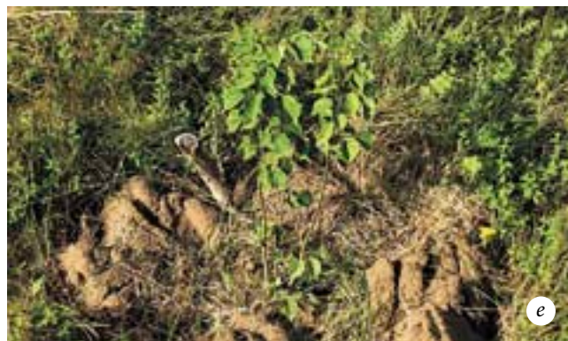
Выращивание липы: а — всходы липы в питомнике (посев производился осенью); б — всход-дичок в лесу; в — сеянцы липы первого года жизни в середине лета; г — сеянцы липы в начале второго года жизни; д — сеянец липы, выращенный в комнатных условиях и высаженный в конце лета на улицу; е — двухлетний саженец липы, высаженный на постоянное место

Кроме посева семян можно использовать пересадку всходов липы, появляющихся под кронами старых деревьев после обильного урожая семян. Всходы липы имеют семядоли очень характерной лопастной формы, поэтому их легко находить. Мелкие всходы (еще не имеющие настоящих листьев, а только семядоли) легко переносят пересадку, если ее производить в прохладную и влажную погоду. При благоприятных условиях «диких» всходов легко можно накопать на целую грядку. Поскольку прорастание семян липы происходит довольно поздно и недружно, всходы надо начинать искать уже после того, как на взрослых липах начнут распускаться первые листья.