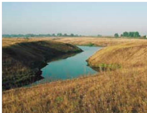
Склоны оврагов и берега рек и прудов — подходящие участки для посадки новых лесов в «малолесных» районах