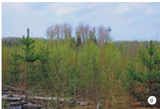
а — дикий лес обычно состоит из многих поколений деревьев, и место погибших старых деревьев быстро занимают новые, более молодые, деревья; б — большинство вырубок и гарей в лесной зоне России быстро зарастает молодыми деревьями, в первую очередь лиственными