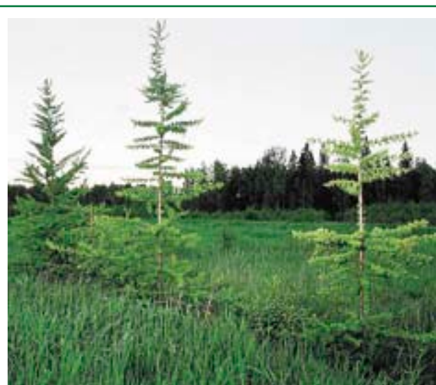
Посадки лиственницы Сукачева на заброшенных сельскохозяйственных землях через четыре года после высадки (Архангельская область)

2. Восстановление пород деревьев, исчезающих или практически исчезнувших в лесах вашего региона или района вследствие хозяйственной деятельности человека. Таких немало, особенно в регионах с длительной историей хозяйственного освоения природных лесов. Например, в большинстве регионов Севера Европейской России за последние несколько столетий сильно сократилось количество лиственницы Сукачева — в первую очередь из-за того, что эта древесная порода специально выборочно заготавливалась для строительства различных специальных объектов (древесина лиственницы медленнее всего гниет в воде, и поэтому она издревле пользовалась особым спросом во многих европейских странах). Во многих регионах того же Европейского Севера сильно сократилось количество пихты и сибирского кедра — эти два дерева находятся здесь на самой западной границе своего распространения и потому наиболее чувствительны