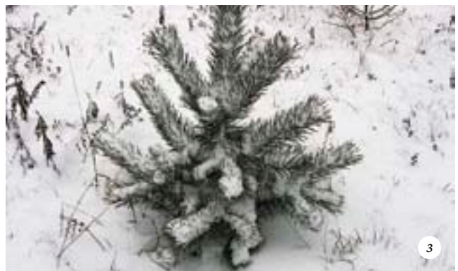
Выращивание сосны: а — всходы сосны через месяц после посева; б — сеянцы первого года жизни в середине лета; в — однолетние сеянцы в начале весны; г — сеянцы второго года жизни, пересаженные в «школку»; д — сеянцы второго года жизни, не пересаженные в «школку»; е — посадка в «школку» двухлетних сеянцев; ж — саженцы четвертого года жизни в «школке»; з — четырехлетняя сосна, высаженная на постоянное место в трехлетнем возрасте