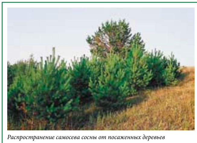
Распространение самосева сосны от посаженных деревьев

Полезно (а если вы хотите создать подобие естественной лесной экосистемы, то просто необходимо) подсаживать в ваш лес различные виды кустарников. Так же как при выращивании деревьев, старайтесь использовать только те кустарники, которые естественным образом произрастают в вашей местности. Как правило, лесные кустарники имеют значительно меньшую продолжительность жизни, чем деревья, и быстрее развиваются и размножаются естественным образом (если для этого есть необходимые условия — в первую очередь защитный полог древостоя). Поэтому чаще всего достаточно принести