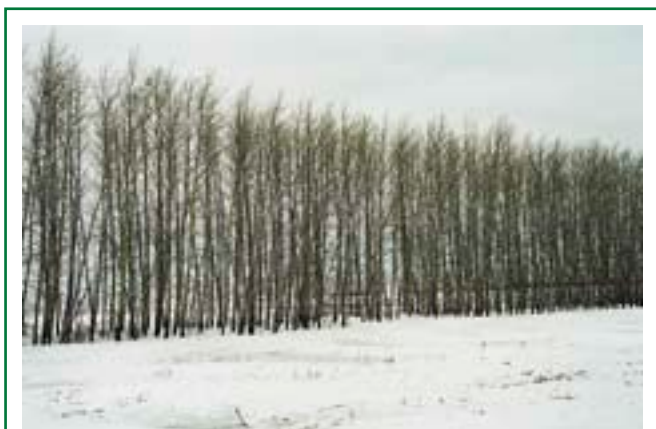
Одной из разновидностей лесоразведения является создание защитных полос, сберегающих поля от засух и ветров. Такие полосы очень важны и нужны, но они еще не являются полноценным лесом — поскольку не способны образовать по-настоящему лесную среду

Создание защитных лесонасаждений — не единственная цель разведения новых лесов на ранее безлесных участках. Подобные леса могут создаваться и с хозяйственными целями — для обеспечения деревень и поселков местными источниками топлива (дровами или хворостом) и некоторыми строительными материалами. Специально выращиваемая топливная древесина (которая может также получаться как побочный продукт ухода за молодым лесом — его прореживания) позволяет отказаться от использования невозобновляемых природных ресурсов, таких как нефть, газ или уголь. Кроме того, выращивание топливной древесины на окраинах населенных пунктов или на заброшенных полях и различных бросовых землях создает дополнительные рабочие места, столь необходимые для большинства сельских населенных пунктов. Благодаря тому, что использование местных искусственно выращиваемых древесных ресурсов дает сельским населенным пунктам новые рабочие места и позволяет отказаться от привозных невозобновляемых видов