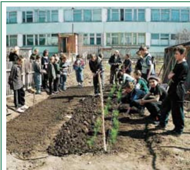
Закладка небольшого лесного питомника в школе: слева — посевное отделение, справа — «школка»

повреждения посадок скотом (вытаптывание, обкусывание): они быстрее достигнут той высоты, при которой скот им уже не страшен. При озеленении городов и поселков также чаще всего используются саженцы — в основном для того, чтобы как можно быстрее получить результат.