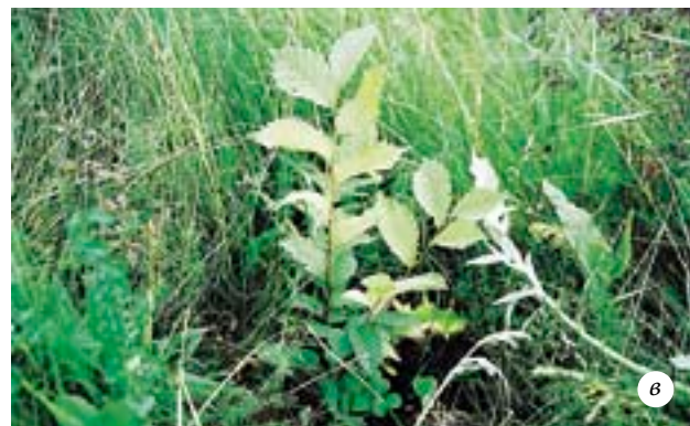
Выращивание вяза: а — всходы вяза через две недели после посева семян; б — сеянцы первого года жизни в середине лета; в — однолетний сеянец, высаженный на постоянное место, через два месяца после посадки