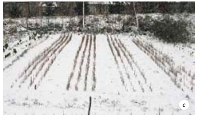
Выращивание лиственницы: а — всходы лиственницы через месяц после посева; б — густой посев (12-15 граммов семян на метр) позволяет получить больше сеянцев меньшего размера; в — редкий посев (5-10 граммов семян на метр) позволяет получить меньше сеянцев большего размера; з — общий вид питомника лиственницы через месяц после посева; д — питомник осенью; е — питомник в начале зимы

Пересадку производите в течение одного дня, стараясь, чтобы каждый сеянец как можно меньше находился на воздухе — это позволит в максимальной степени сохранить его корни от высыхания. В теплую погоду корни сеянца, не защищенные от солнца и ветра, могут засохнуть и погибнуть в течение нескольких минут. Старайтесь как можно меньше повреждать корневые системы сеянцев: чем большая их часть сохранится при пересадке, тем лучше будут развиваться сеянцы в последующие годы.