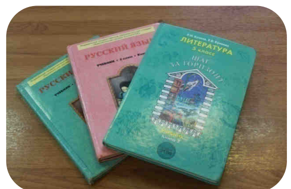
Пополнение библиотечного фонда