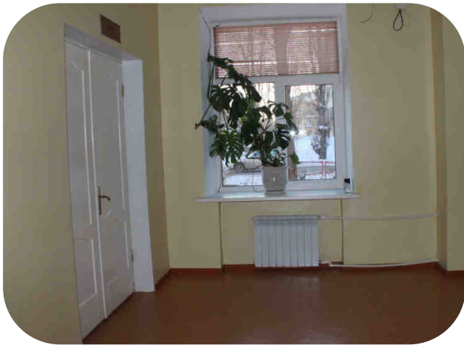
Ремонт первого этажа