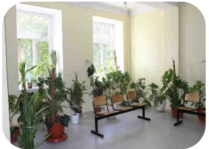
Ремонт первого этажа