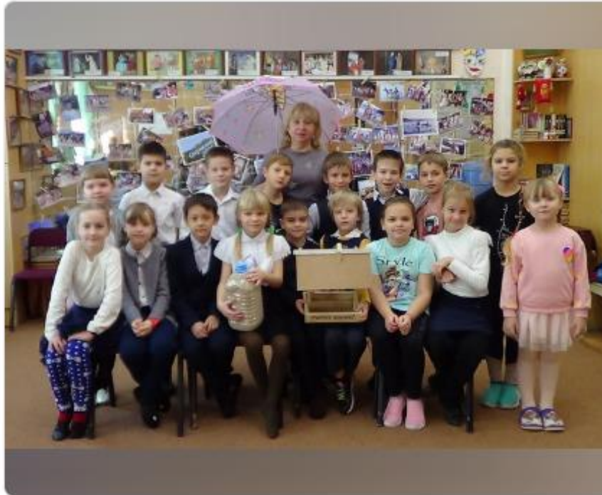
Занятия для детей

#ДЮЦВосхождение #ДополнительноеобразованиеХабаровск #Управлениеобразованияхабаровск #Кормимптиц #столоваядляптиц #добро #МыживемвЖелезнодорожном #микрорайонПривокзальный #кафедляптиц #педагогиВосхождения #детиВосхождения #акцииВосхождения