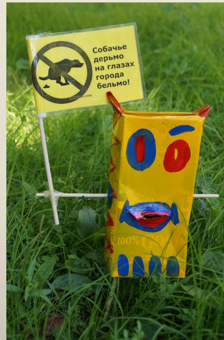
Акция «Чудики на эко-защите города»