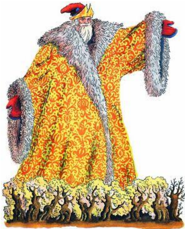
«СТАРИК ГОДОВИК» В. И. ДАЛЬ

ышел старик годовик. Стал он махать рукавом и пускать птиц. Каждая птица со своим особым именем. Махнул старик годовик первый раз — и полетели первые три птицы. Повеял холод, мороз.