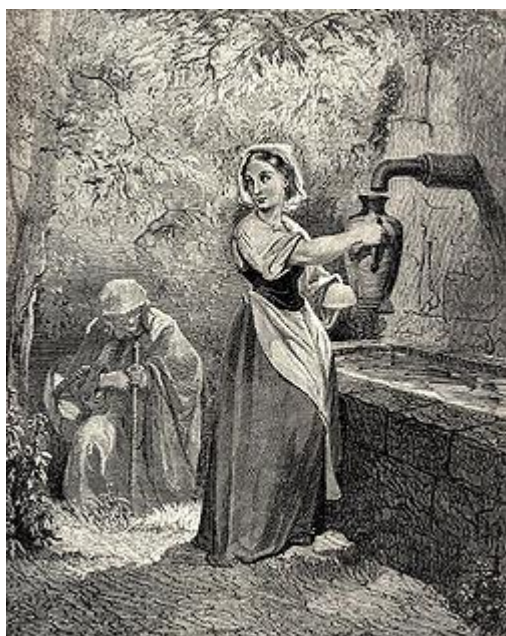
И л л ю с т р а ц и я Г ю с т а в а Д о р е .

Жила-была вдова, у которой были две дочери: старшая до того на неё походила и лицом и нравом, что, как говорится, не развёл бы их. Так они были обе горды и неприветливы, что, кажется, никто бы не согласился жить с ними. Младшая, напротив, вышла в отца кротостью и вежливостью, да и сверх того красавица она была необыкновенная. Всякому человеку нравится то, что на него походит, мать была без ума от старшей дочери, а к младшей чувствовала отвращение неодолимое. Она заставляла её работать с утра до вечера и не позволяла ей обедать за столом, а отсылала её в кухню.