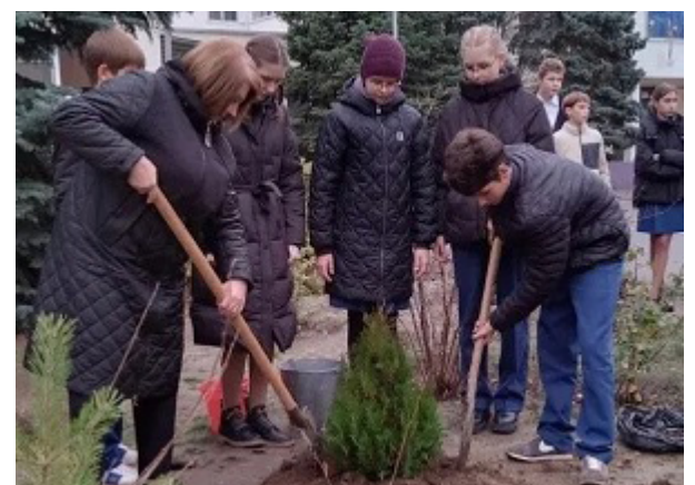
Дерево Дружбы ребята 7А класса посадили во дворе школы