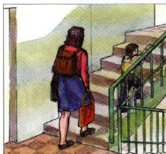
Перенести на верхние этажи продовольствие, ценные вещи, одежду, обувь