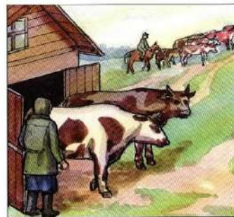
Перегнать скот на возвышенные места