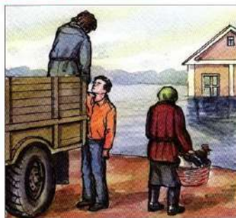
Эвакуировать население из опасных районов