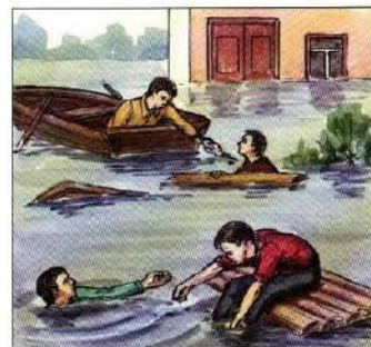
Оказать срочную помощь людям, очутившимся в воде