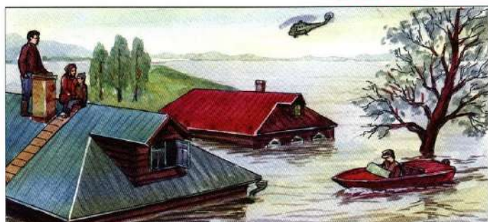
Спасать людей, где бы они ни оказались, используя для этого любые средства