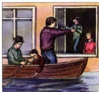
В первую очередь из зоны затопления вывезти детей