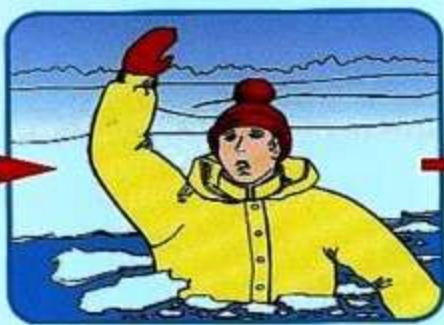
Не паниковать, позвать на помощь