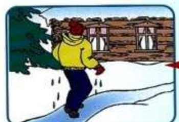
Не отдыхая, бежать к ближайшему жилью