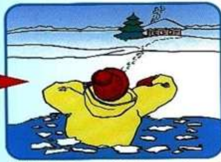
Выбраться в сторону, с которой произошло падение