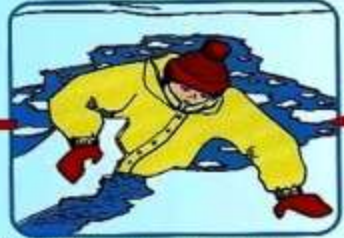
Забросить на лед ногу, откатиться от полыньи