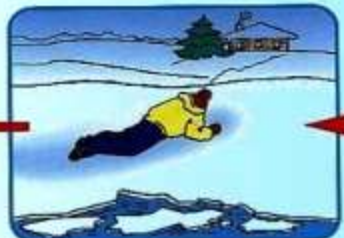
Проползти 3-4 метра по своим следам