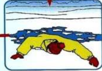
Наползая на лед, раскинув руки в стороны