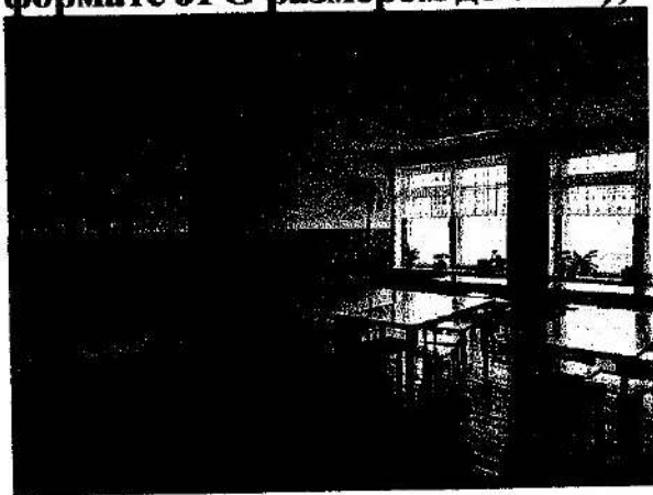
фото (состояние объекта «До» в формате JPG размером до 5 Мб);

визуализация будущего проекта (рисунок, схема, чертеж в формате JPG размером до 5 Мб);