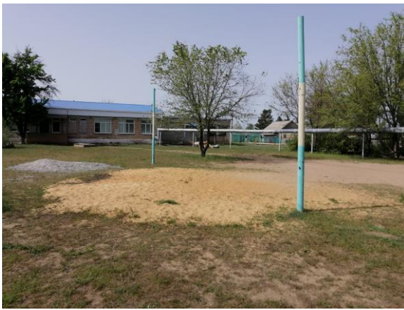
Рис.1 фото «До»