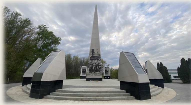
Стела «Город трудовой доблести»