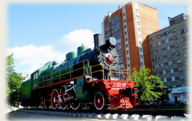
Паровоз-памятник Су 213-89