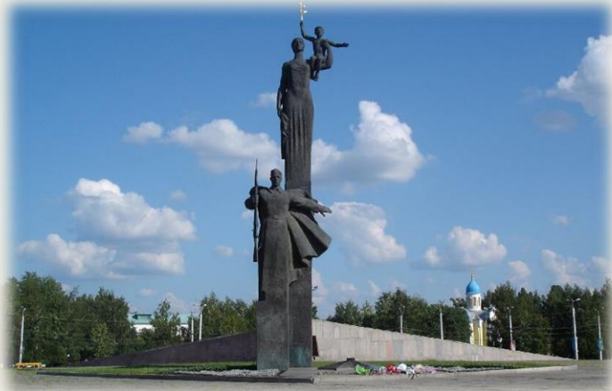
Монумент воинской и трудовой славы