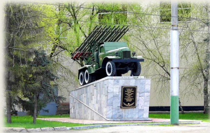
«Катюша» перед заводом Пензмаш