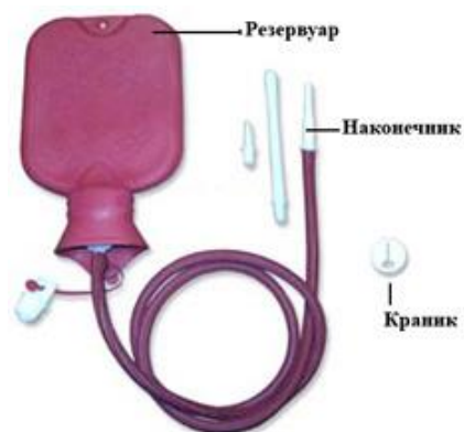
Рисунок 1 - Клизма