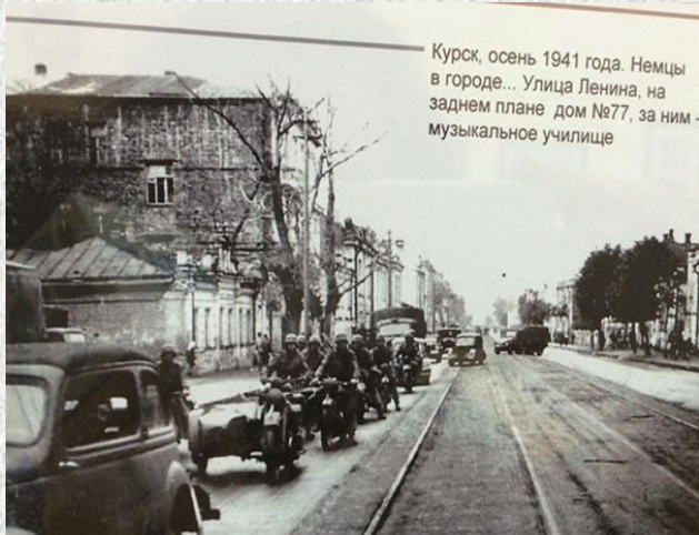
Курск, осень 1941 года. Немцы в городе... Улица Ленина, на заднем плане дом №77, за ним - музыкальное училище