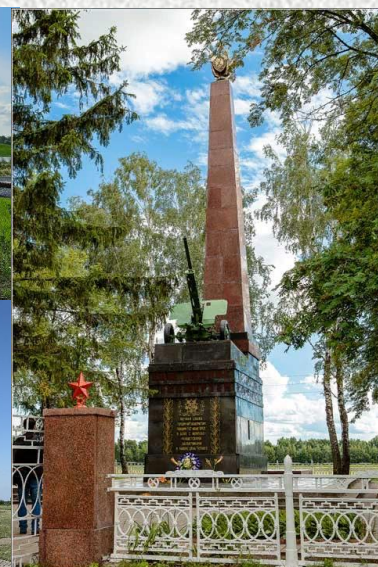
Поныровский историко– мемориальный музей Курской битвы