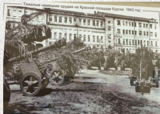
Тяжелые немецкие орудия на Красной площади Курска. 1942 год