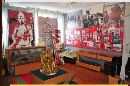
Музей Юные защитники Родины