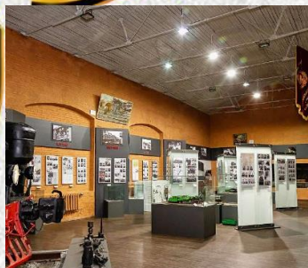
Музей истории Курского железнодорожного узла г. Курск