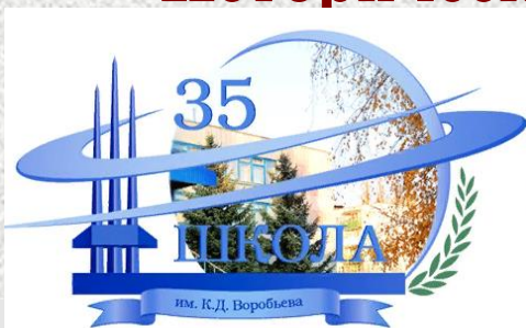
Музей истории Железнодорожного округа на базе МОУ «СОШ № 35 им. К.Д. Воробьева»