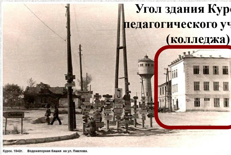
Угол здания Курского педагогического училища (колледжа)