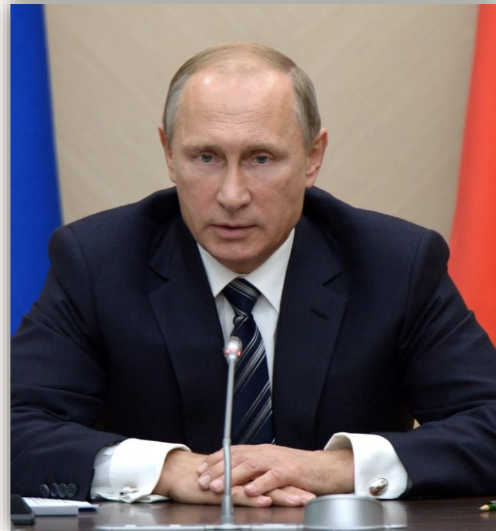
Президент РФ, В.В. Путин

«В подвигах фронтовиков и тружеников тыла проявилась истинная жизненная сила нашего народа, его единство, победный дух и любовь к родной земле. Наши отцы и деды одолели мощного, беспощадного врага, перед которым спасовали, отступили многие страны. Именно советский народ принёс свободу другим народам».