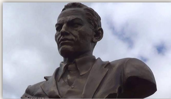
Памятник легендарному советскому разведчику Рихарду Зорге