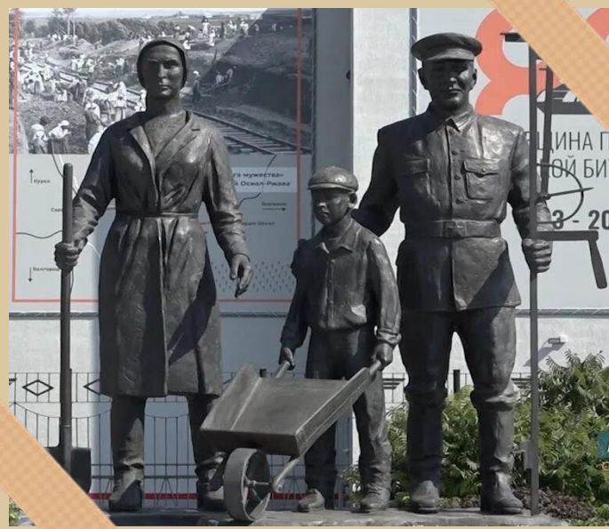
Памятник труженикам тыла в Старом Осколе