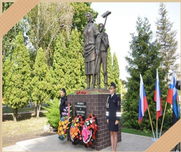
Памятник труженикам тыла в селе Веселое