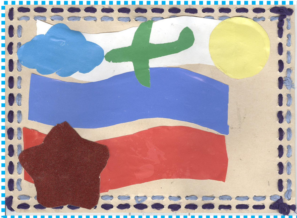
«Открытка для папы»