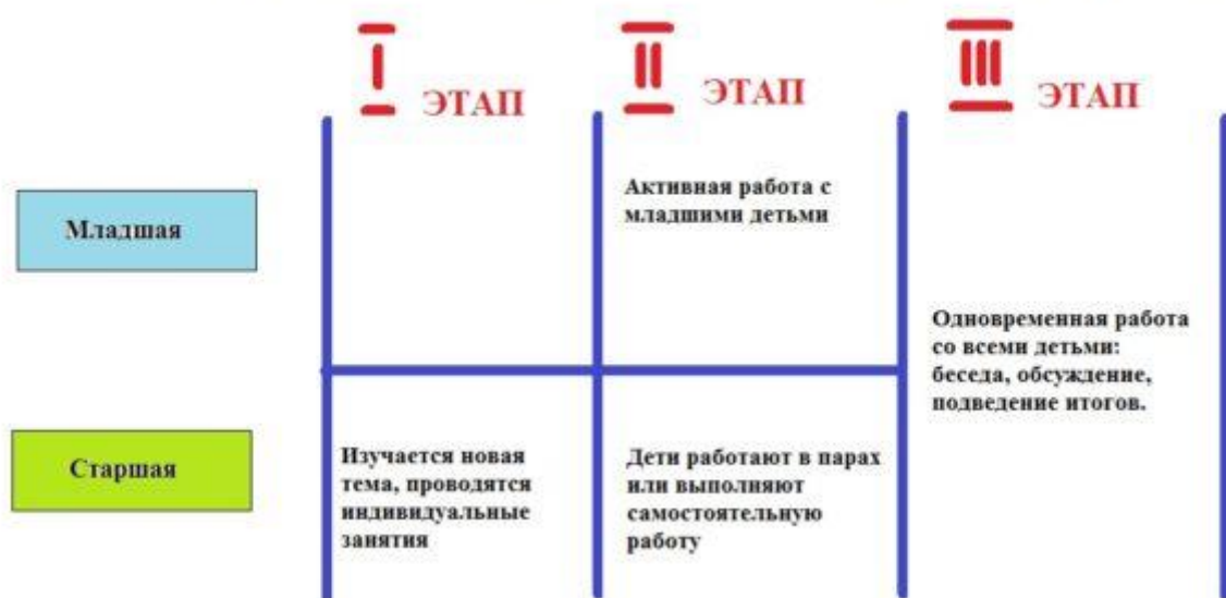
СХЕМА ПРОВЕДЕНИЯ ЗАНЯТИЯ С ПОЭТАПНЫМ НАЧАЛОМ.

Можно использовать другую схему — заканчивать занятия по очереди с каждой группой.