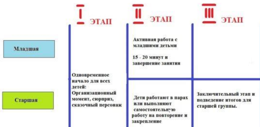
СХЕМА ПРОВЕДЕНИЯ ЗАНЯТИЯ С ПОЭТАПНЫМ ОКОНЧАНИЕМ

Примерный объём организованной – образовательной деятельности в разновозрастной группе