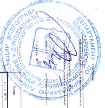
Район 1. Поступления и выплаты