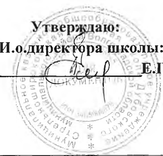
График проведения занятий внеурочной деятельности на 2023 - 2024 учебный год