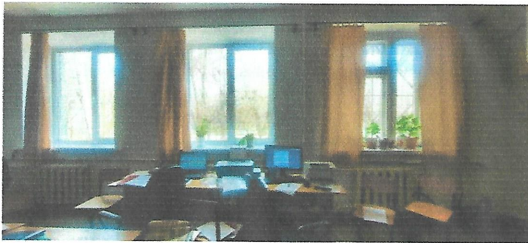
Рис. 2 Визуализация будущего проекта