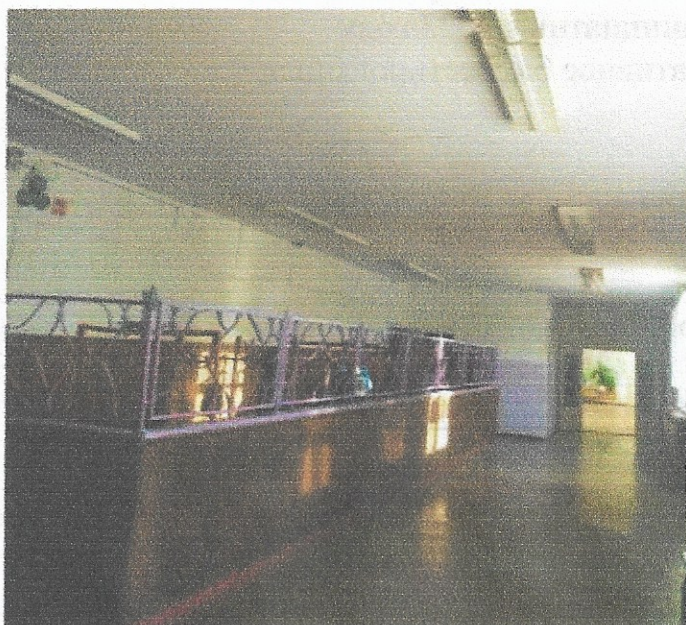
Рис. 1 Состояние объекта «До».