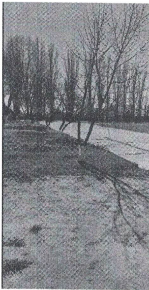
Визуализация будущего проекта