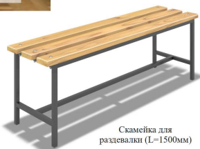
Скамейка для раздевалки (L=1500мм)