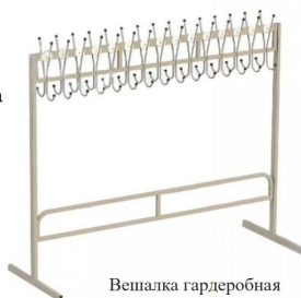
Визуализация будущего проекта (мебель)

- Визуализация будущего проекта (схема) (рис. 2)