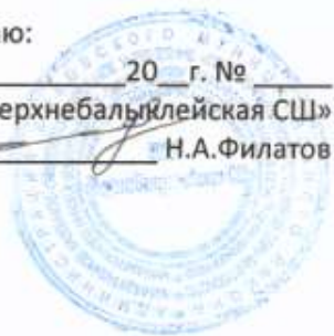
ГРАФИК проведения оценочных процедур по географии в 2022-2023 учебном году 3 четверть