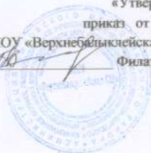
График проведения оценочных процедур за 3 четверть в 2023 учебном году