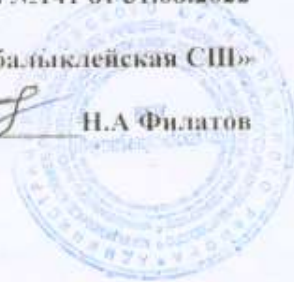
График оценочных процедур по музыке 3 четверть в 2022-2023 учебном году