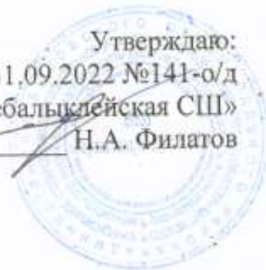
ГРАФИК проведения оценочных процедур по технологии в 2022-2023 учебном году (3 четверть) 5 класс