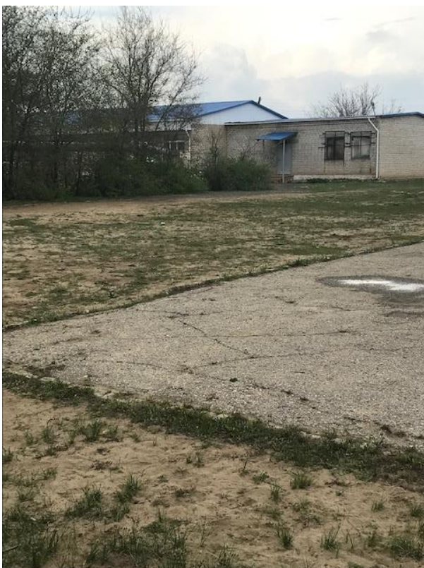
Рис.1 фото «До» площадка для занятия спортом.