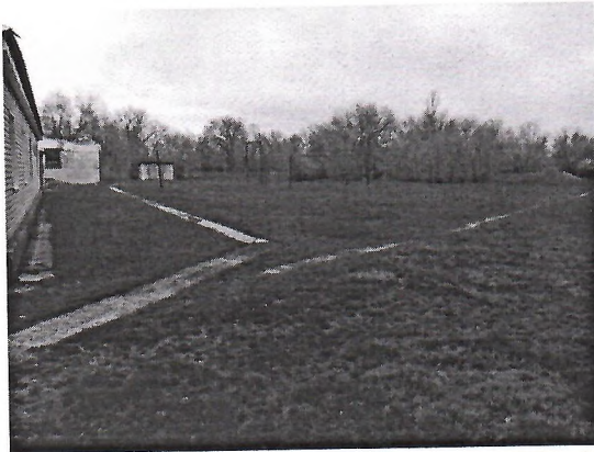
– фото (состояние объекта «До»);