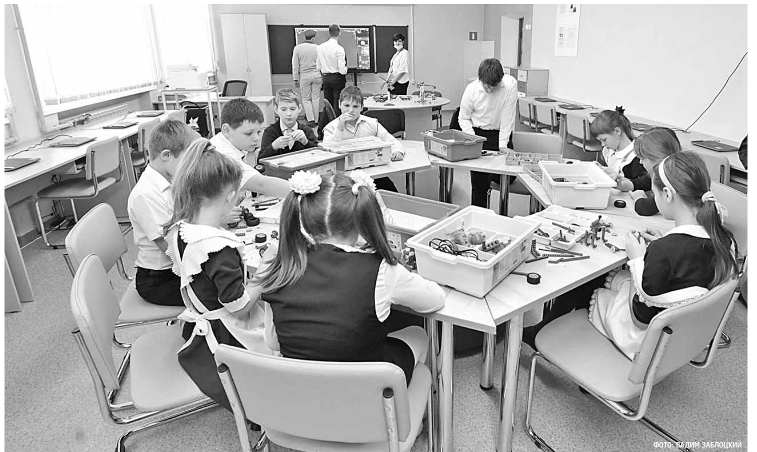
В «Точке роста» Алексеевской школы Корочанского района