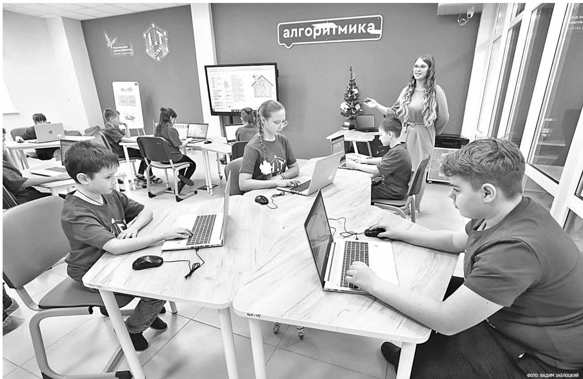
На занятии алгоритмикой в IT-кубе

КАК УПРАВЛЕНЧЕСКИЙ АСПЕКТ ОБНОВЛЕНИЯ СОДЕРЖАНИЯ ОБРАЗОВАНИЯ ПОМОЖЕТ ДОСТИЖЕНИЮ НАЦИОНАЛЬНЫХ ЦЕЛЕЙ И СТРАТЕГИЧЕСКИХ ЗАДАЧ