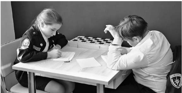
Рассчитать ценность шахматных фигур — задача нелёгкая