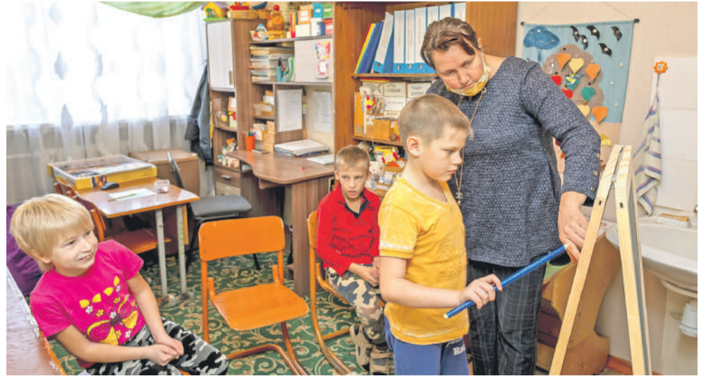
Творческие занятия на внеурочке