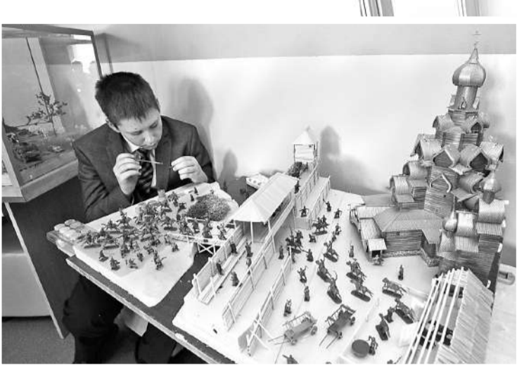
Вот такой макет старинной крепости ребята сделали своими руками