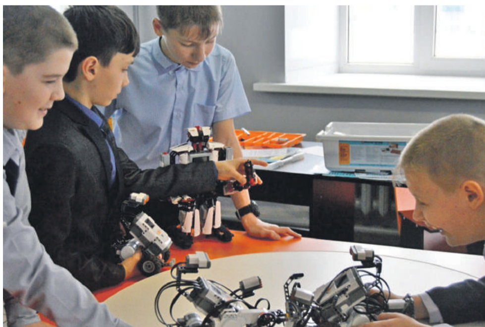
Технопарк в школе № 1

Ещё один важнейший элемент современной инфраструктуры — создание цифровой образовательной среды. Для решения проблемы взаимоотношений «цифровые ученики и нецифровые» учителя создали школьный медиацентр «МедиаДикт».