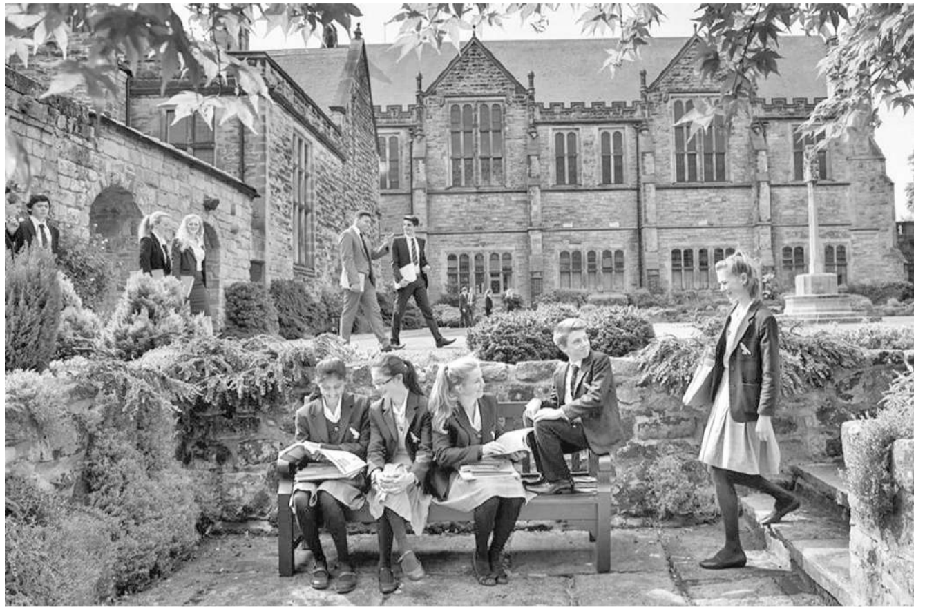
В некоторых канадских школах от формы и не думали отказываться