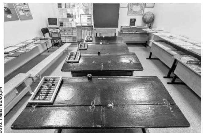
Зал истории образования в музее Томаровской школы № 1

С тех пор все уроки русского языка, литературы и беседы о советском обществе проходили без курьёзов. Молоденькая учительница даже съездила в областное управление кинофикации. Договорилась каждую неделю по пятницам привозить в колонию фильмы.