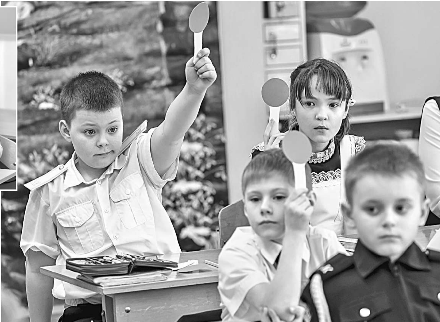
Использование техники «Светофор» в начальной школе

Задания разные: схемы, вопросы (в том числе в формате «допиши фразу или предложение») и даже ребусы. Выполнить их ребята должны за определённое