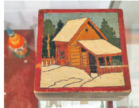
Шкатулка-коробочка «Зима в деревне» (1930-е гг.)