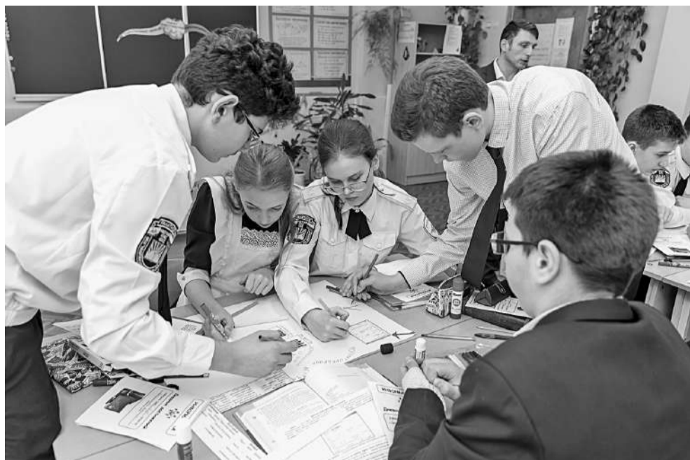
Заполнение ментальной карты