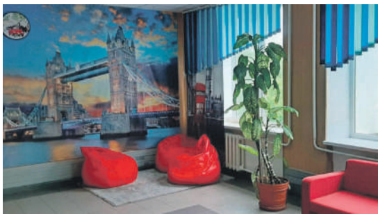
Рекреационная зона в школе № 1