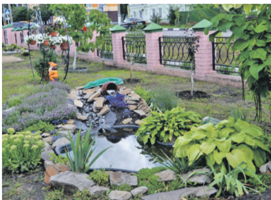
Ландшафтный дизайн на территории школы № 2