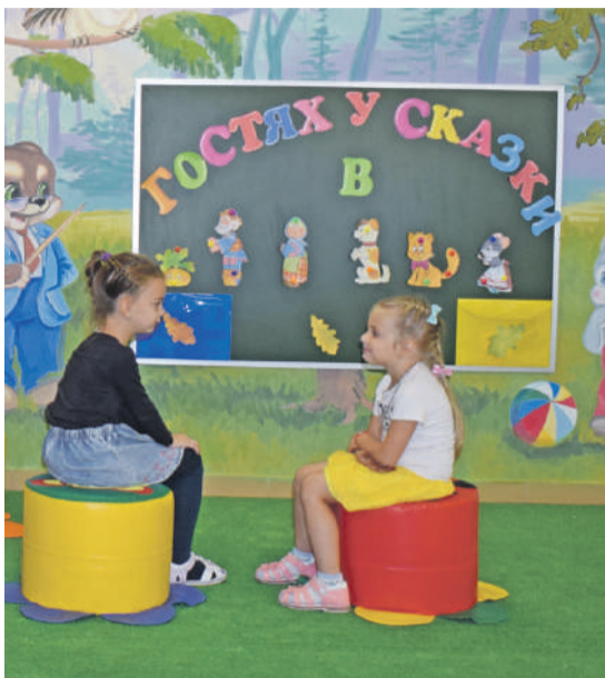
В детском саду № 4