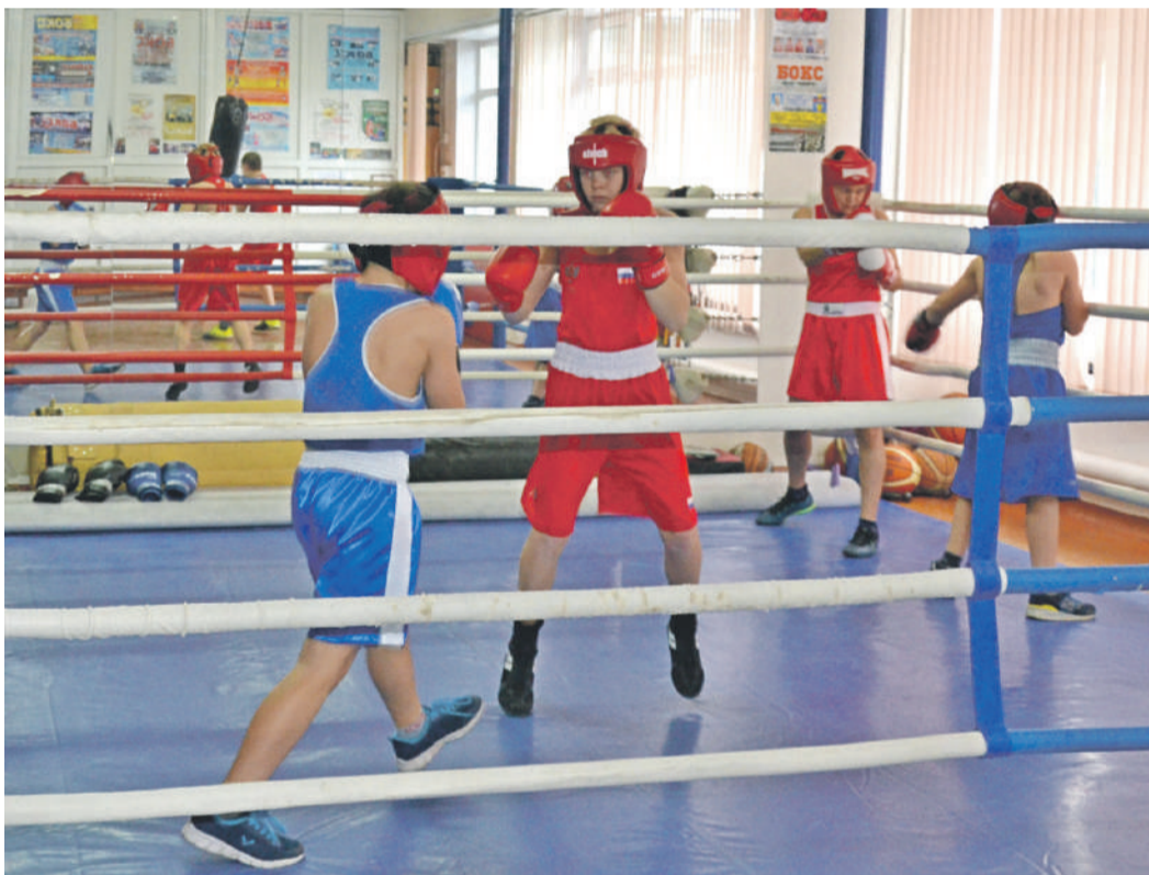
Тренировки по боксу в школе № 4