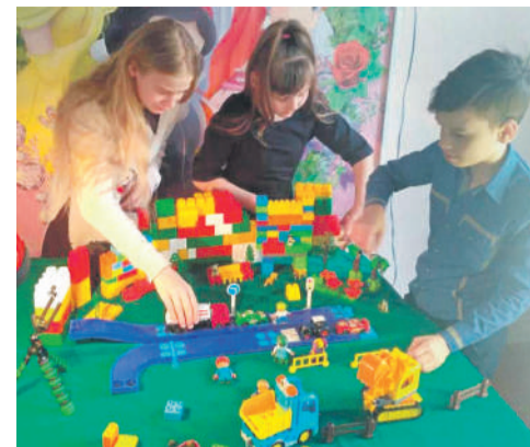
Студия мультипликации в Доме детского творчества