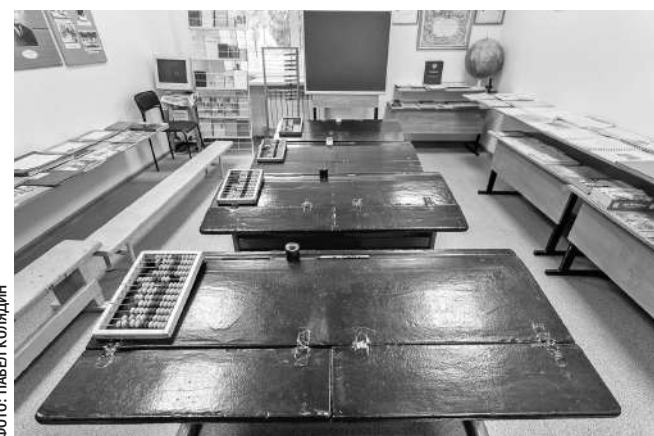
Зал истории образования в музее Томаровской школы № 1

С тех пор все уроки русского языка, литературы и беседы о советском обществе проходили без курьёзов. Молоденькая учительница даже съездила в областное управление кинофикации. Договорилась каждую неделю по пятницам привозить в колонию фильмы.