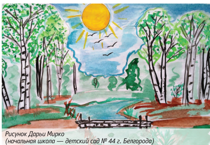
Рисунок Дарьи Мирко (начальная школа — детский сад № 44 г. Белгорода)