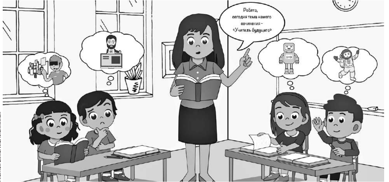
РИСУНОК ЕКАТЕРИНЫ КАСАКИНОЙ

Общая сумма выделенных средств — 10 млн рублей. Из них федеральное финансирование — около 8,5 млн. Почти 1,4 млн —