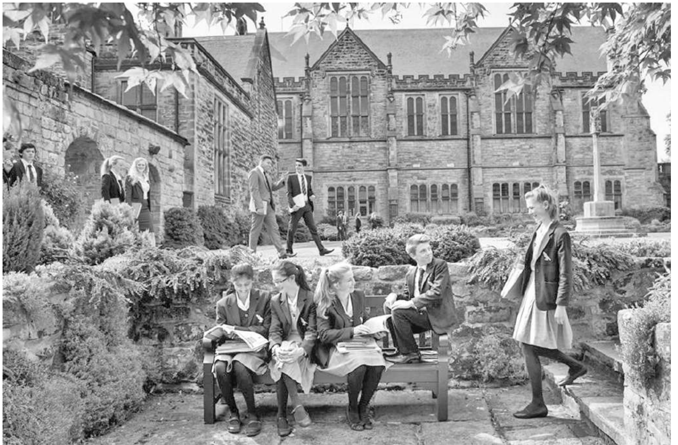
В некоторых канадских школах от формы и не думали отказываться