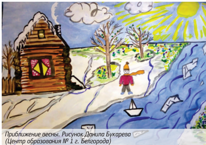
Приближение весны. Рисунок Даниила Букарева (Центр образования № 1 г. Белгорода)