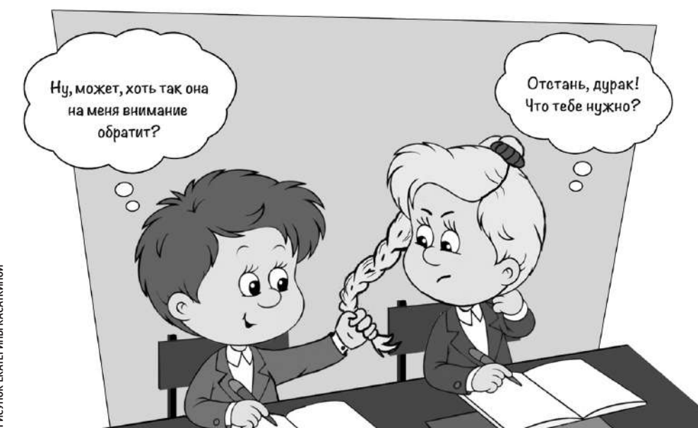
РИСУНОК ЕКАТЕРИНЫ КАСАКИНОЙ

Наши подростки переживают чувства влюблённости, первой любви, дружбы — это прекрасные человеческие чувства и отношения,