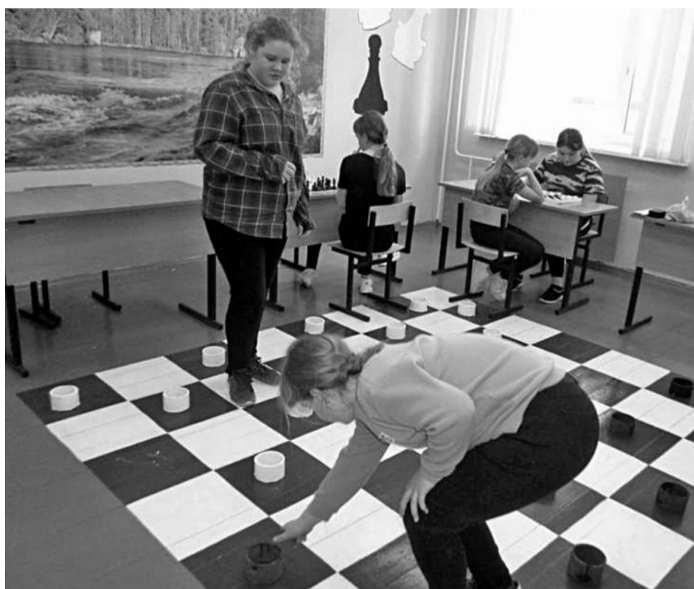
Игровая зона в Глинской школе