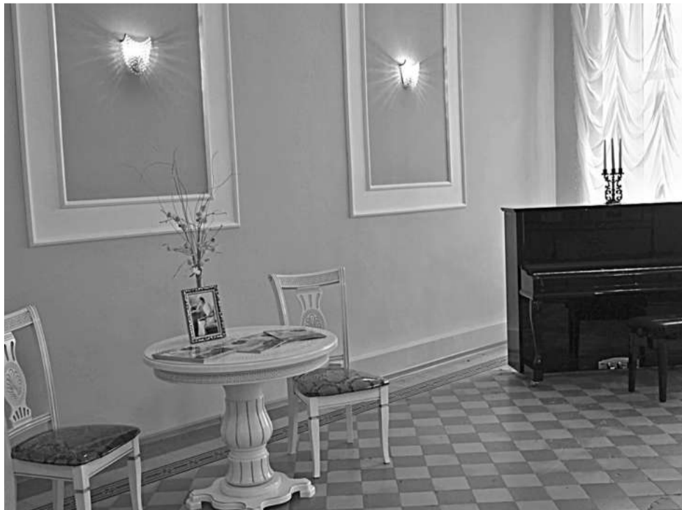
Ольгинский зал школы № 1