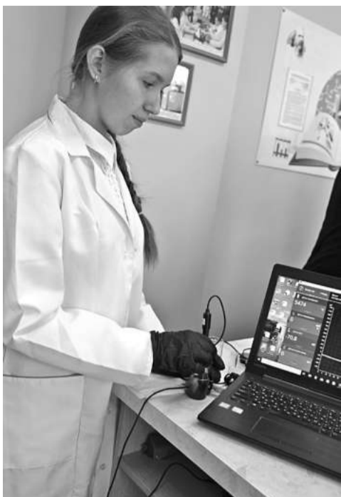
В школе № 1

КОЛЛЕГИ! МЫ ПРИГЛАШАЕМ ВАС СТАТЬ НЕ ТОЛЬКО ЧИТАТЕЛЯМИ, НО И АВТОРАМИ ГАЗЕТЫ!