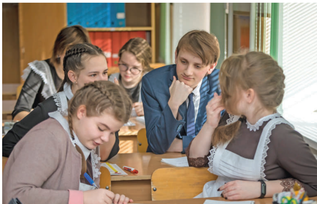
Урок обществознания в 10-м «Б» классе

Ольга МУШТАЕВА » ТЕКСТ, Павел КОЛЯДИН » ФОТО