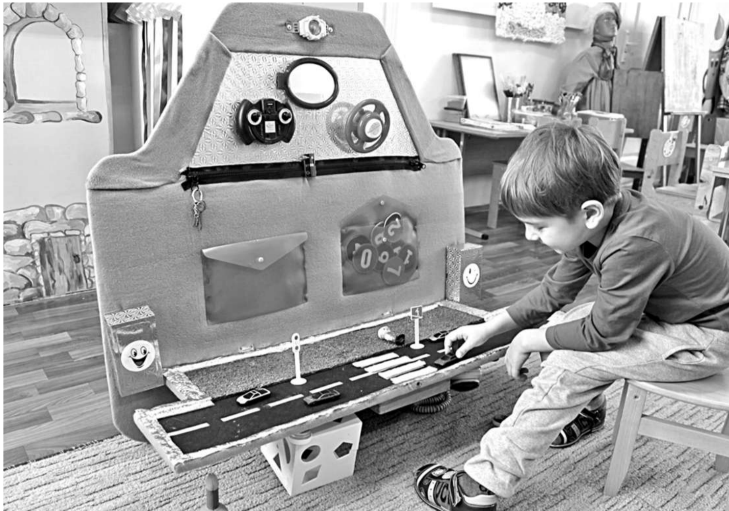
Игровая зона в детском саду № 8

СЕГОДНЯ СВОИМ ОПЫТОМ ДЕЛЯТСЯ УЧРЕЖДЕНИЯ ОБРАЗОВАНИЯ НОВООСКОЛЬСКОГО ГОРОДСКОГО ОКРУГА