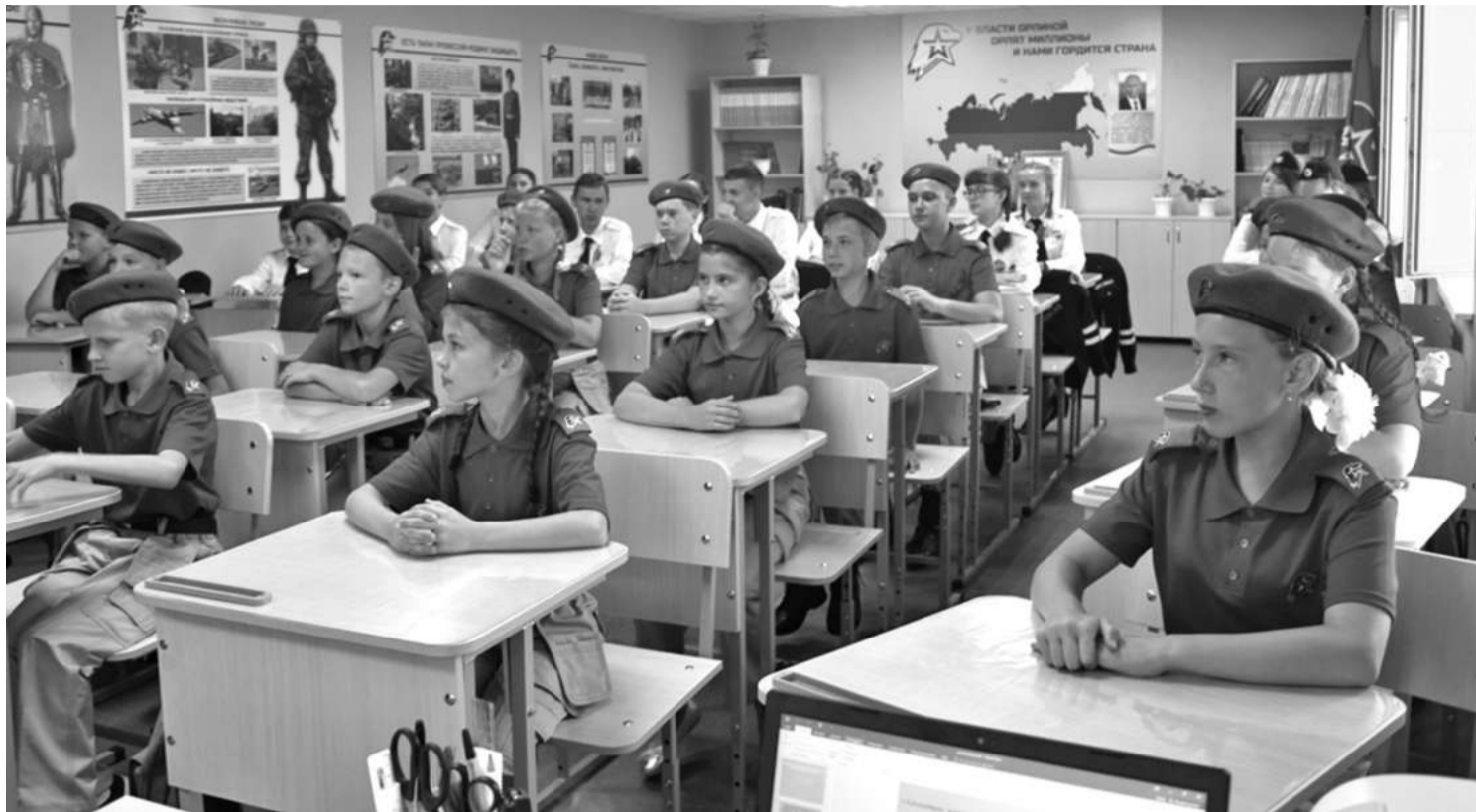
Кадетский класс школы № 1

В результате реализации проекта в школе создали лабораторию, которую можно без преувеличения назвать кузницей пытливых, талантливых юных исследователей. Ученики от четвёртого до выпускного классов занимаются наукой. В рамках постпроектной деятельности рядом с лабораторией оформлена развивающая зона «Химия занимательная и увлекательная», которая рассказывает об опытах,