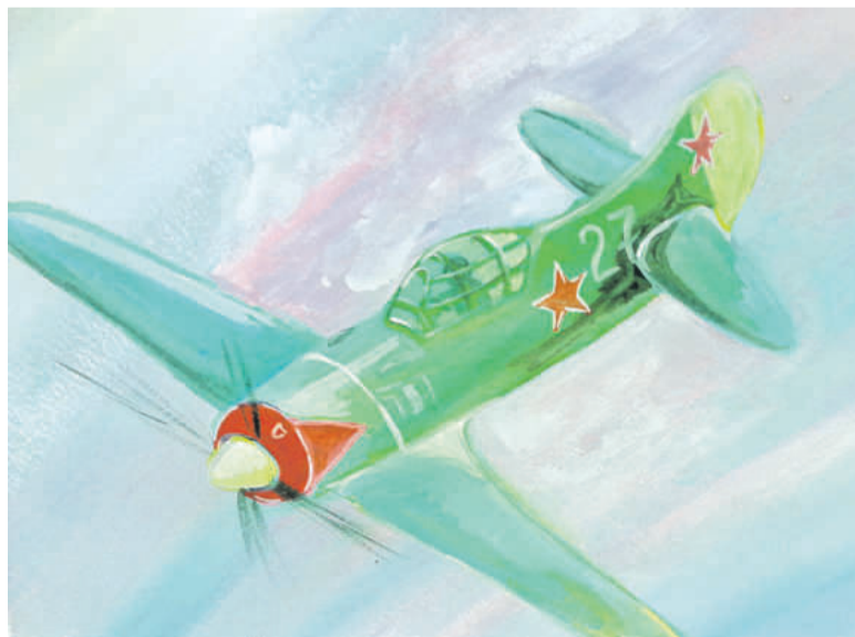
Воздушный бой. Рисунок Дмитрия Новикова (Корочанская школа им. Д. Кромского)