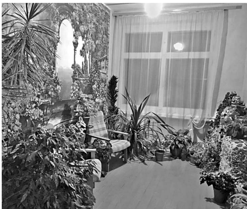
Зимний сад в Васильдольской школе