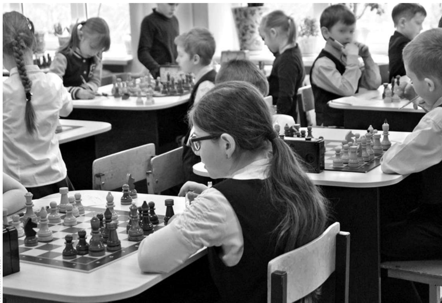
В образовательном комплексе «Луч»

— Высокий уровень локального нормотворчества. В этих учебных заведениях есть хорошо проработанные локальные нормативные акты, которые обеспечивают порядок. Основные образовательные программы и программы развития направлены на активное познание мира, развитие учебно-исследова-