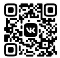
ПАБЛИК В СОЦСЕТИ «ВКОНТАКТЕ» HTTPS://VK.COM/KAFEDRA_DZOT

Созданная группа в соцсети позволит учителям физкультуры оперативно обмениваться лучшими практиками, делиться опытом регионов, конкретных образовательных учреждений.