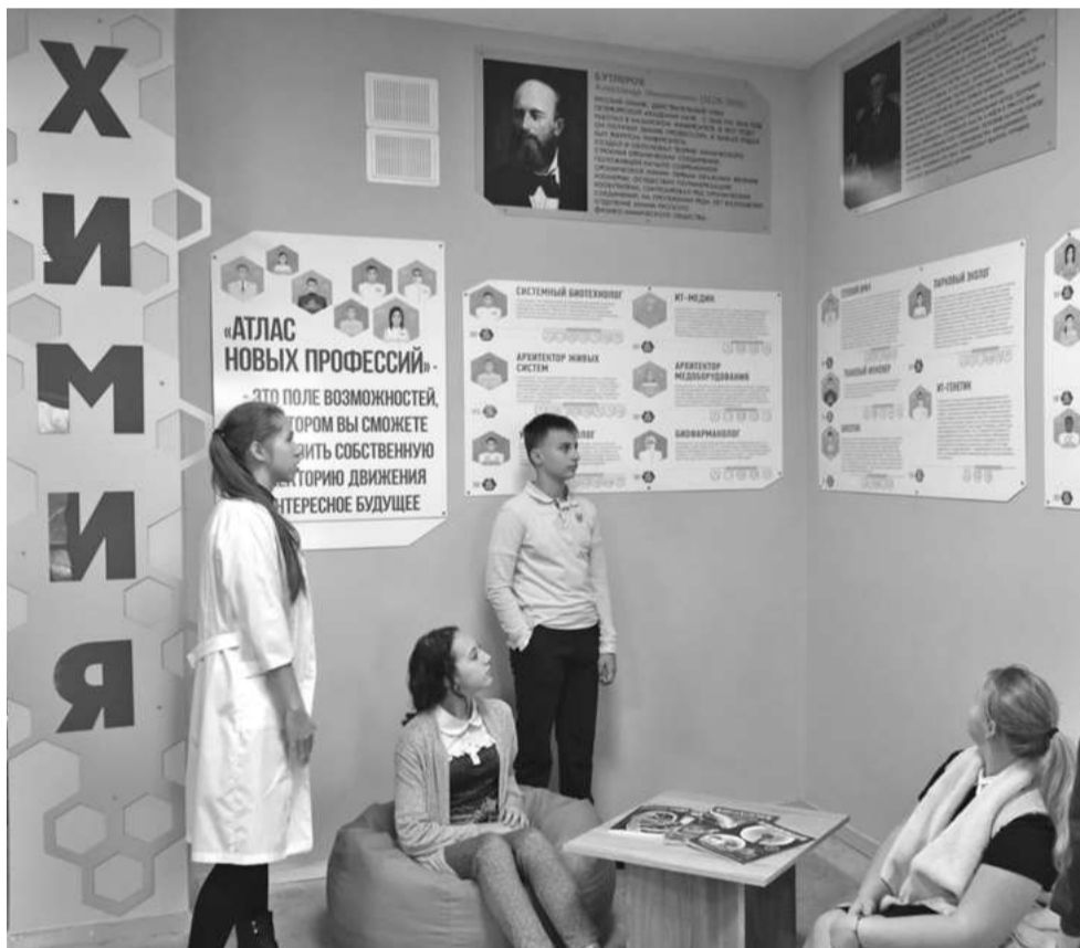
Профориентационная зона в школе № 1