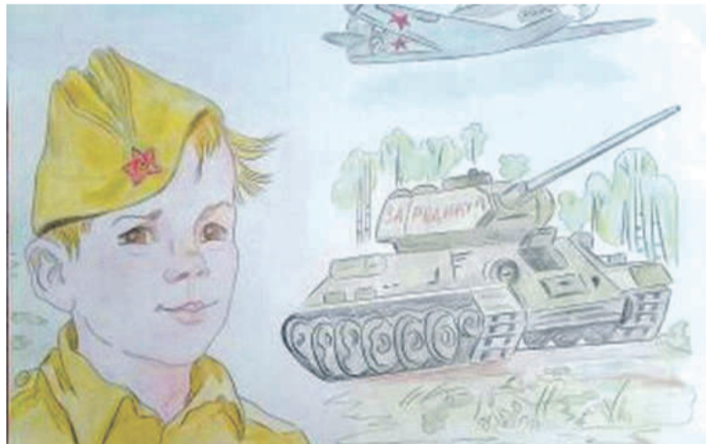
Рисунок Дарьи Лопиной (Корочанская школа им. Д. Кромского)