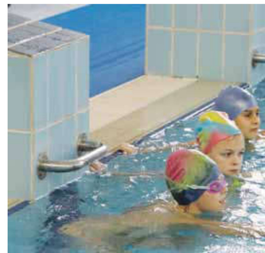
Ученики школы № 2 занимаются в бассейне ФОКа