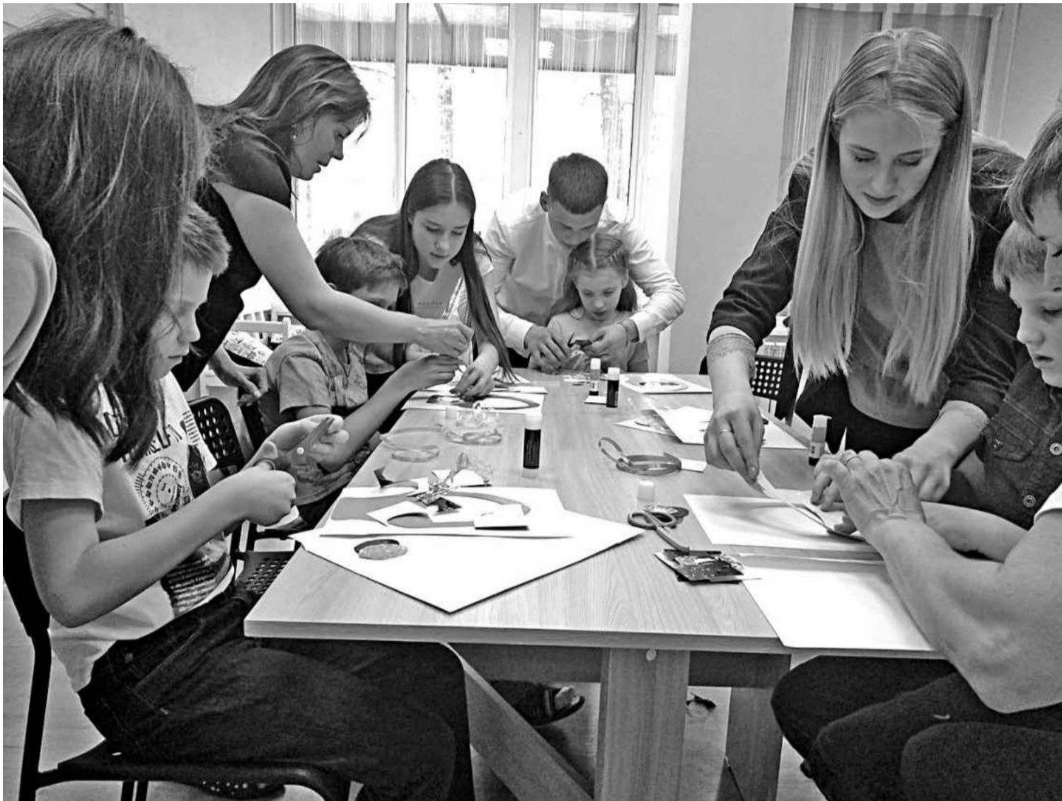
Воронежские волонтеры проводят занятия с подопечными «АутМамы»

ОБ ОПЫТЕ ВОРОНЕЖСКОЙ ОБЛАСТИ В РАБОТЕ С ДЕТЬМИ С РАС