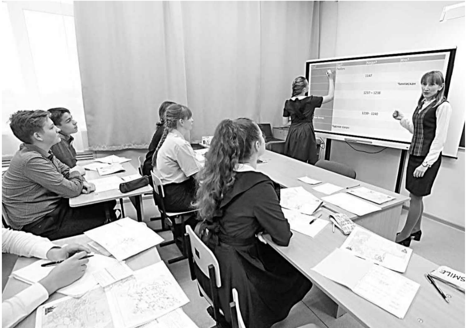
Несколько смарт-досок для школ района приобрели в рамках нацпроекта «Образование»

Почему только час? Потому что расписание очень насыщенное. И учебными делами детям нужно заниматься дозированно, иначе проку никакого не бу-