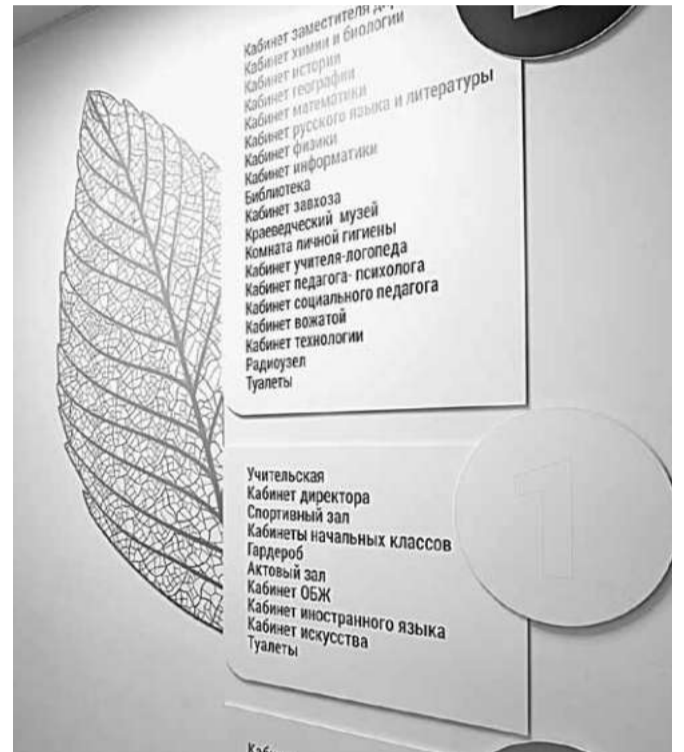
Элементы бережливых технологий в Краснояружской школе № 2