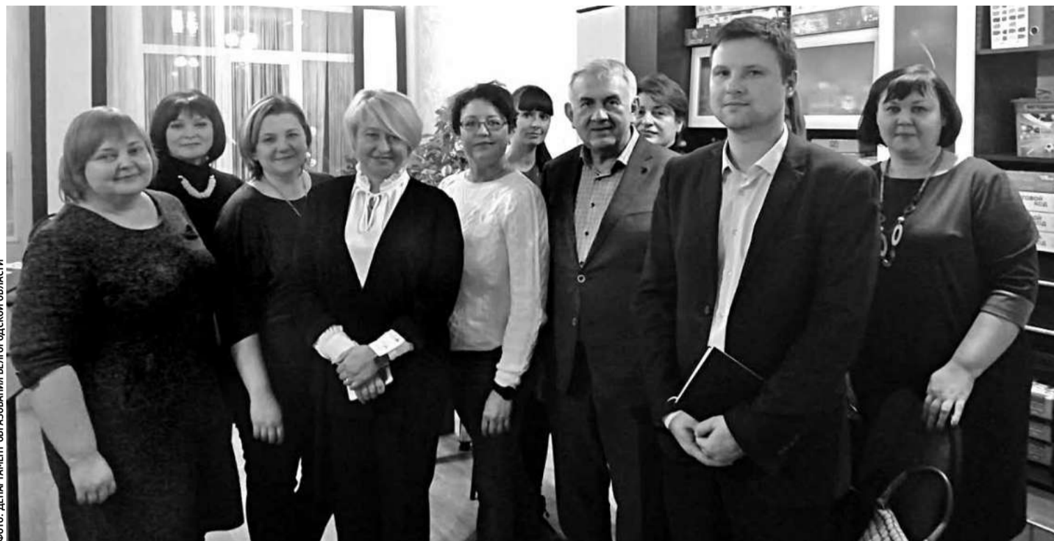
Белгородская делегация в гостях у воронежских коллег

Так же, как и в Белгородской области, в Воронежской действуют различные фонды, региональ-