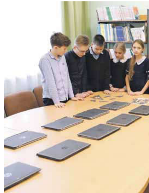
В библиотеке школы № 2