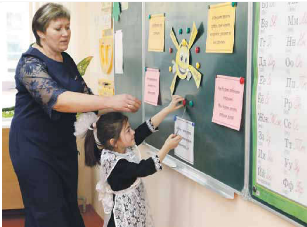
Урок в начальной школе села Степное