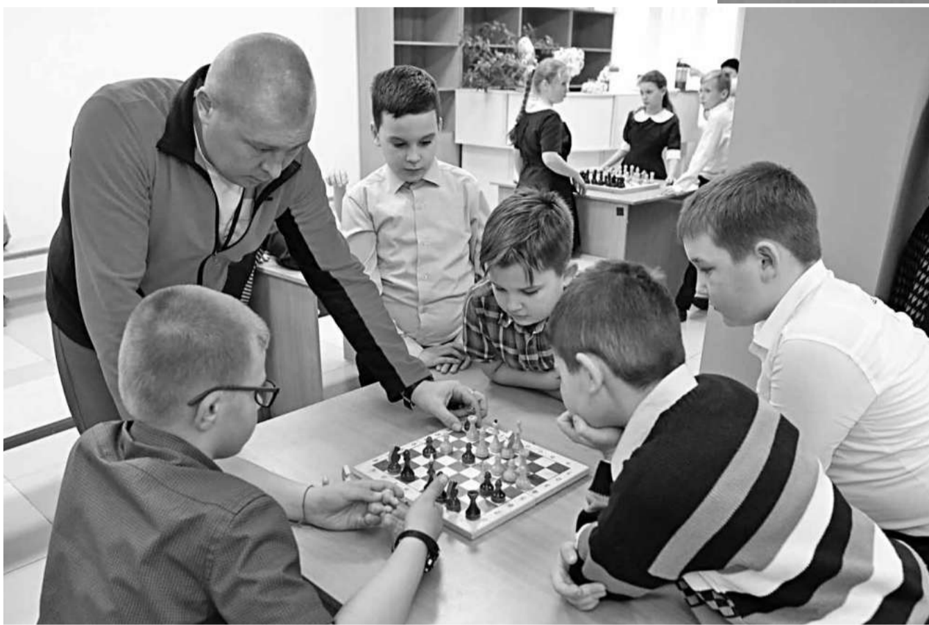
Шахматные перемены в Красноярской школе № 2