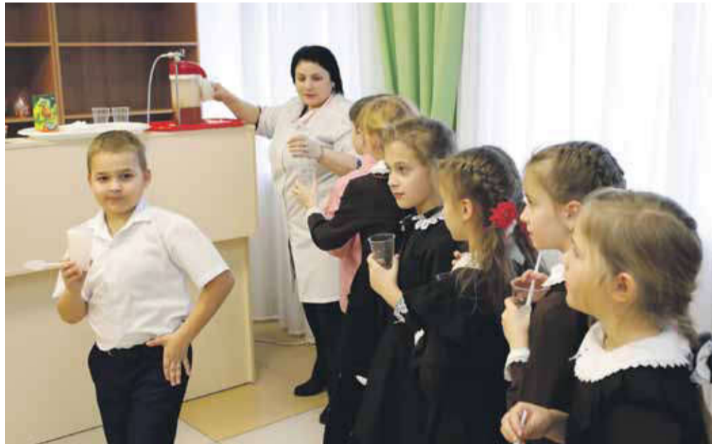
Каждый ученик школы № 2 за год проходит курс кислородных коктейлей

Школу села Степное часто называют многонациональной. Так сложилось, что в 90-е годы сюда переехали жить несколько десятков семей турок-месхетинцев. Люди здесь прижились, построили дома, родили детей, нашли работу... Но есть одно маленькое но: в большинстве семей до сих пор говорят на родном языке и в селе много детей, вынужденных знать два языка. Но в школе-то обучение ведётся на русском. И все экзамены нужно сдавать на русском языке.