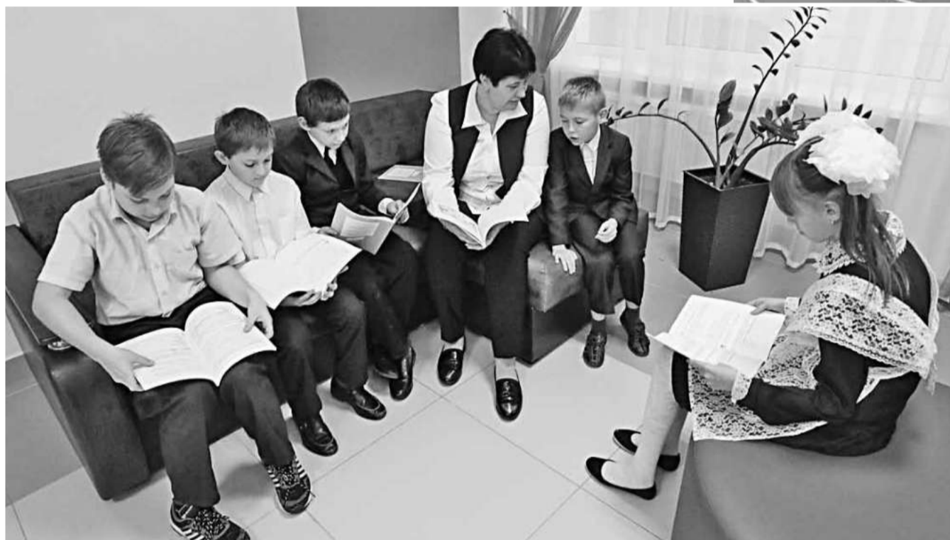
Зоны тихого отдыха в Вязовской школе Красноярского района