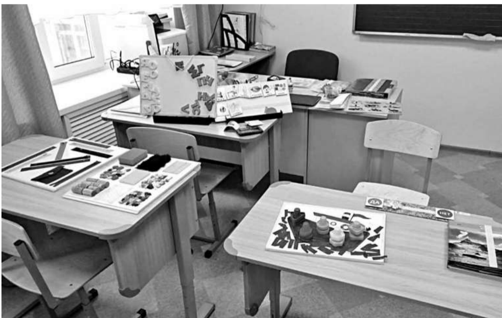
В творческой мастерской для детей с РАС

гружение работников в проблему, их изменившееся мышление и сознание. Специалисты не пытались создать видимость благополучия, а открыто говорили о трудностях, размышляли, рассказывали о поиске оптимальных методов и подходов.