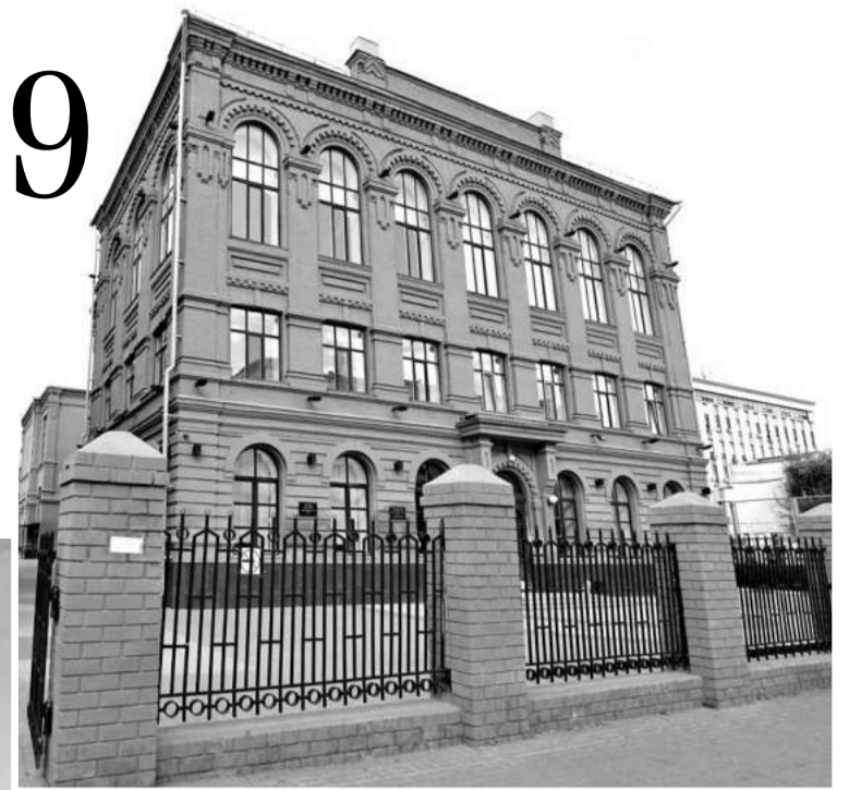
Лицей № 9

— Использование картирования позволило выявить проблемные места в образовательной деятельности и проанализировать возможности их устранения. Сейчас в лицее разработан 21 бережливый проект, шесть из которых уже реализованы.