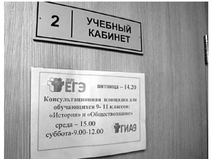
Консультационные площадки в Краснояружской школе № 2