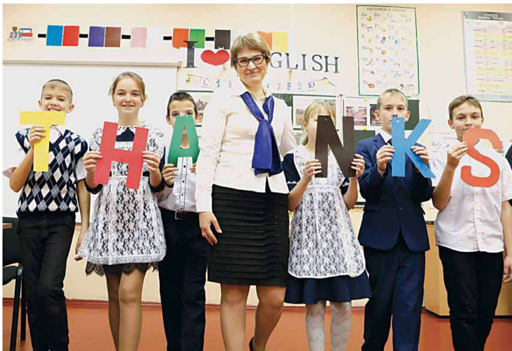
На дополнительных занятиях по английскому языку в Илёк-Пеньковской школе Краснояружского района

Школа полного дня — явление не новое для отечественной педагогической практики. Интерес к этой теме то утихает, то вновь возрастает. Новое осмысление она получила в связи с региональной стратегией «Доброжелательная школа», реализация которой рассчитана на 2019–2021 годы.