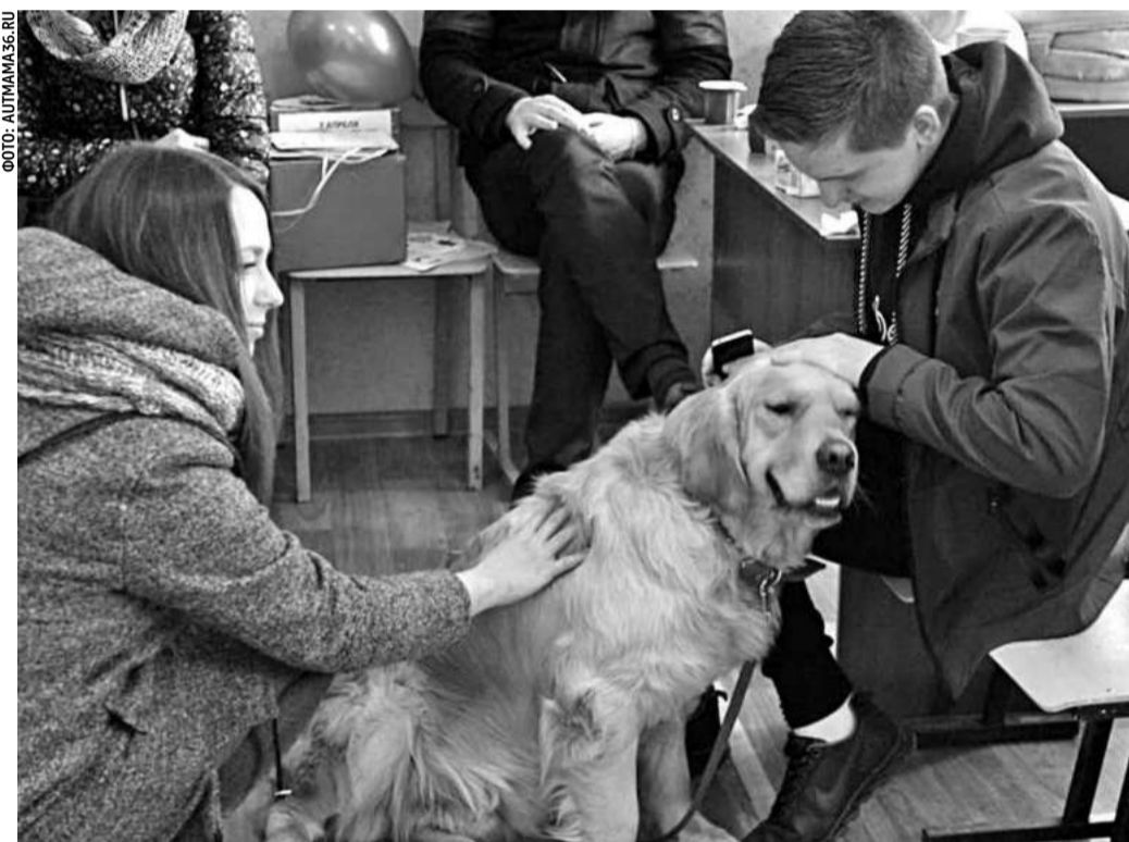
По инициативе воронежской организации «АутМама» используется канистерапия — лечение через общение с собаками

В работе с детьми с РАС в Воронеже активно применяют гончарное дело, для этого в школах создали гончарные мастерские. Через глину дети с РАС привывают друг к другу. Лепка развивает не только мелкую моторику, но и абстрактное мышление, которого у детей с РАС практически нет. В