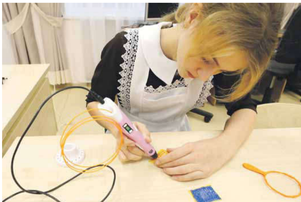
В Вязовской школе дети быстро освоили 3D-ручки