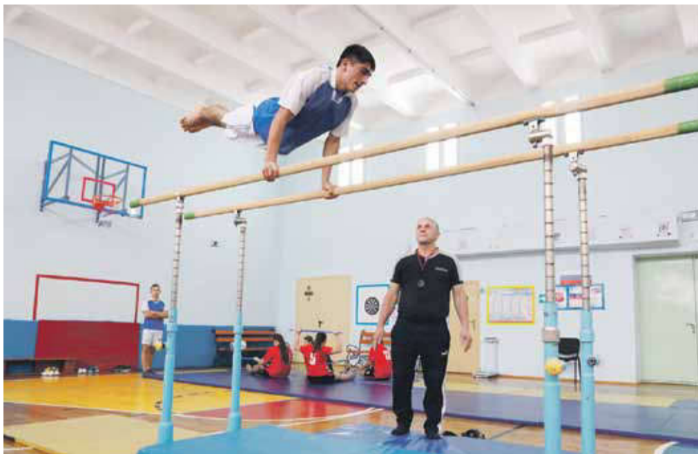
На внеурочных занятиях по спортивной подготовке в Степнянской школе