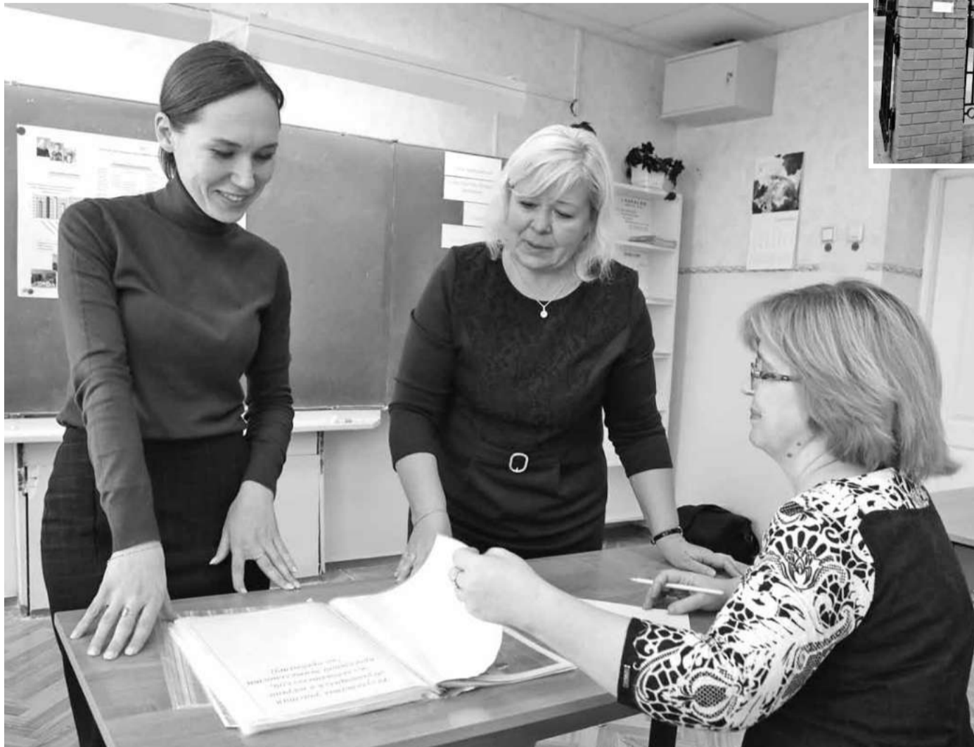
Работа с наставником