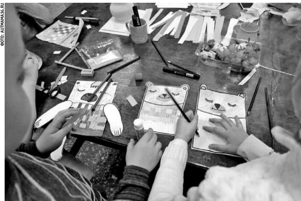
Мастерские для детей-аутистов в Воронеже

долгосрочной перспективе здесь намерены сделать глиняные поделки источником заработка для своих особенных детей. Вопросы распространения воронежского опыта по применению гончарного дела в районах и городских округах Белгородской области будут курировать заместители глав органов местного самоуправления по социальным вопросам.