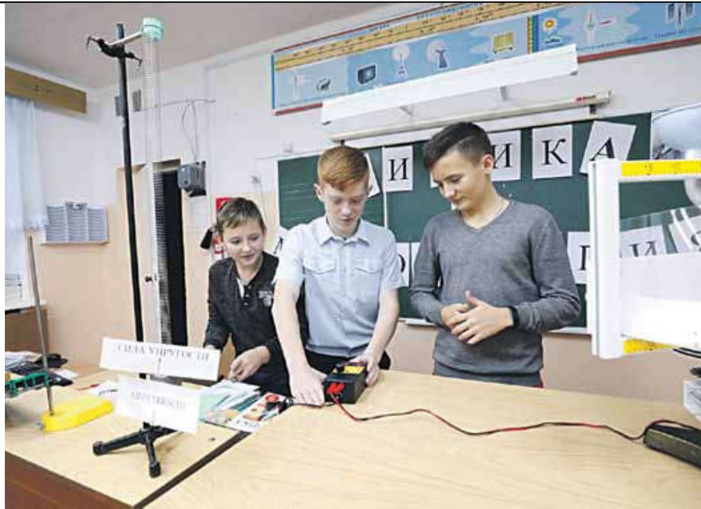
Занятия в кабинете физики. Школа № 1

А ещё школе повезло в том, что она построена единым комплексом с красноярским ФОКом. И школьники могут заниматься в его бассейнах, тренажёрных и спортивных залах. Мало того, по рекомендации врачей мальчишки и девчонки могут в ФОКе бесплатно пройти курс массажа!