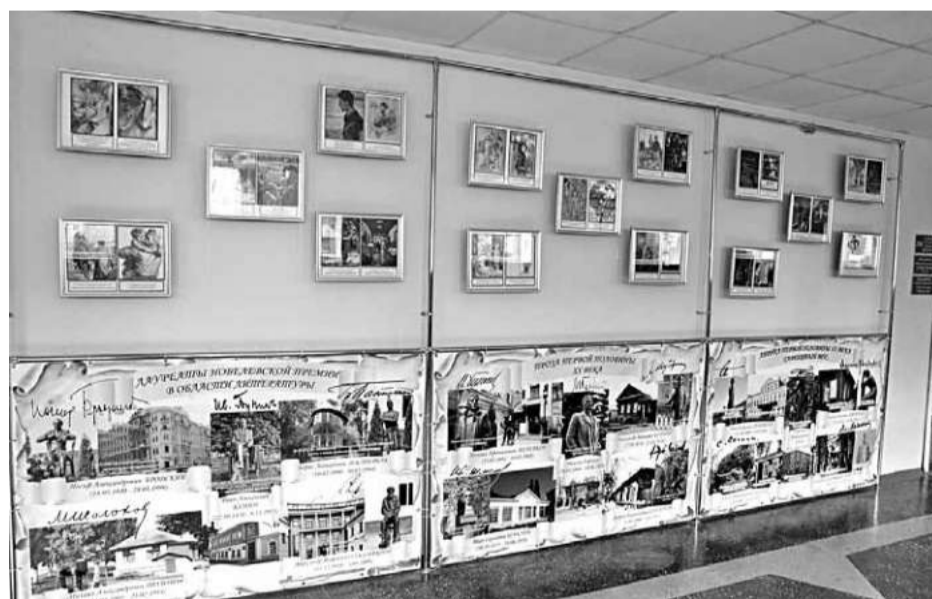
Образовательная зона лицейского литературного музея

На классных часах учителя рассказывают школьникам о способах применения бережливых инструментов на личном рабочем месте. Для