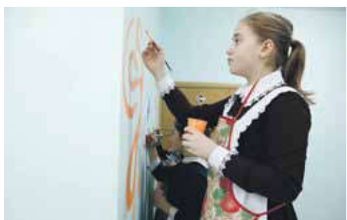
Ученики Степнянской школы сами разукрашивают стены