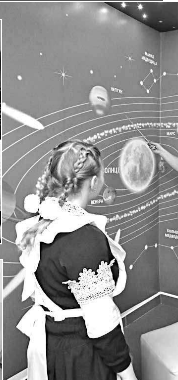
Астрономический уголок в Вязовской школе Красноярского района

Сегодня каждой школе законом разрешено самостоятельно осуществлять деятельность, разрабатывать и принимать локальные нормативные акты, содержащие нормы, регулирующие образовательные отношения. Отношение к принятию локальных нормативных актов должно меняться, оно должно быть заинтересованным со стороны не только педагогов, но и родителей. Не будем забывать, что родители — это равноправные участники образовательных отношений. Расписание — это такой же локальный нормативный акт. И если родители пренебрегли своим правом на участие в его обсуждении, а потом, когда расписание утвердили, стали упорно доказывать, что оно им не подходит, то это неправильно. Тем более что нелинейное расписание имеет право на существование. Главный довод в его пользу — это разнообразие занятий, а следовательно, условие сохранения здоровья и достижение необходимых результатов. Очень мудро поступили в Красноярской школе № 1, согласовав расписание с каждым родителем. Нужно уметь договариваться. Убеждён, что нет нерешаемых вопросов.