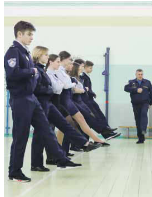
Строевая подготовка у кадетов в школе № 2