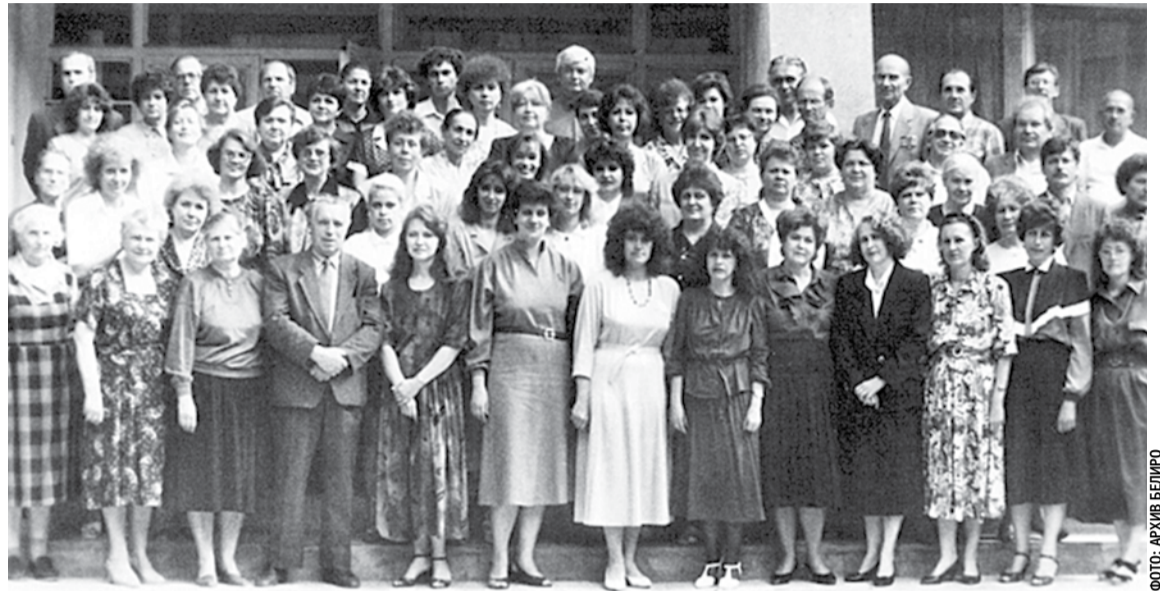
Коллектив Белгородского областного института усовершенствования учителей, 1994 год

Благодаря профессионализму, преданности своему делу, большому трудолюбию, таланту преподавателей, педагогов институт развивался, успешно выполняя свою главную миссию — повышать качество образования Белгородской области. Сегодня наш институт обладает высоким потенциалом, компетентным и работоспособным профессорско-преподавательским составом, который полон творческих планов и замыслов. Надеюсь, что всё это позволит нам эффективно реализовывать как региональные, так и федеральные инициативы. Желаю всем преподавателям и сотрудникам Белгородского института развития образования радости, профессиональных побед, счастья и любви близких, душевного равновесия, интересного и плодотворного учебного года!