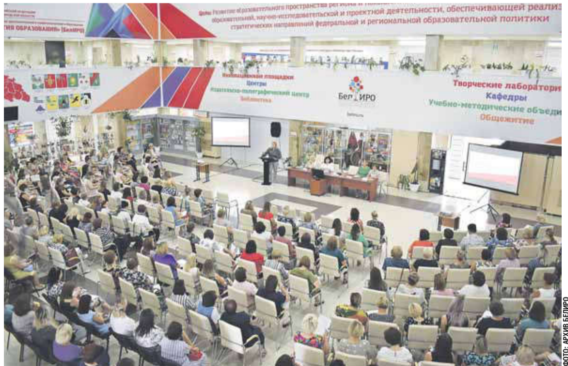
Современный, методически и технологически оснащённый центр непрерывного образования