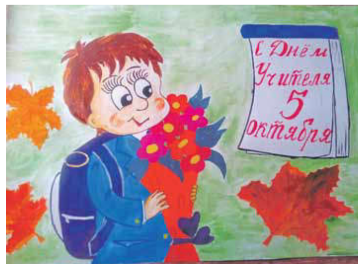
С ДНЁМ УЧИТЕЛЯ! Рисунок Валерии Шиловой (Пятницкая школа Волоконовского района)