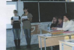
Фестиваль проходил в нашей школе.

С 2011 года газета «Высота 103» принимала участие в различных конкурсах и мероприятиях. Например, стало традицией представлять газету на ежегодном Фестивале студенческих и школьных СМИ «МЕДИАГРАД», который проходит в ВолГУ. И хотя мы еще не занимали призовых мест, но получили бесценный опыт общения и много полезной, важной информации.