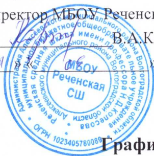
График проведения оценочных процедур МБОУ Реченская СШ в 2021-2022 учебном году