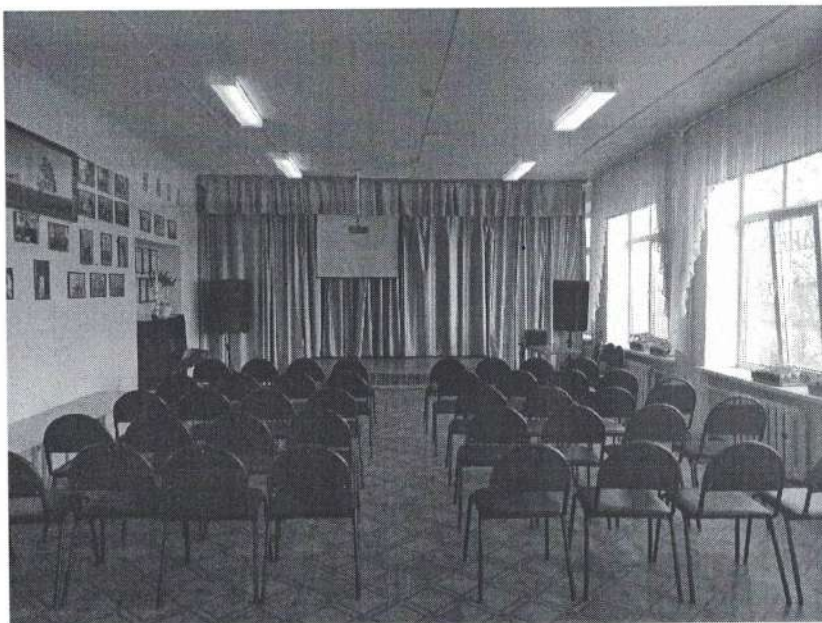
Визуализация будущего проекта