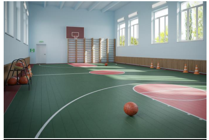
Рис.2 Визуализация будущего проекта