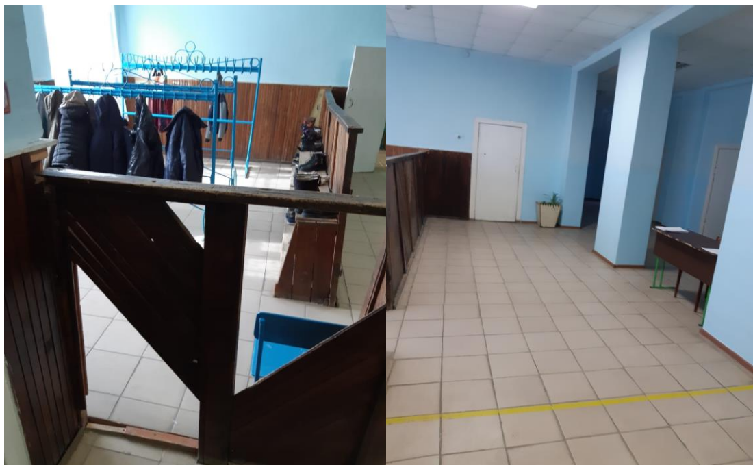
– Рис. 1 (Фото «До»);