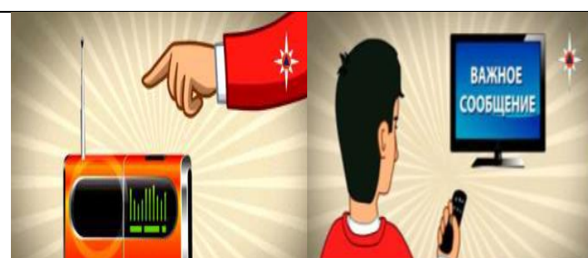
Включите радио, телевизор

Через уличные громкоговорители или другие средства оповещения будет передан звуковой сигнал оповещения. Непрерывное звучание сирены в течение трех минут или прерывистые гудки промышленных предприятий, организаций означают сигнал «Внимание всем!»